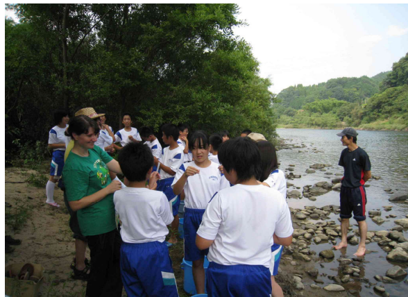
パックテスト状況 (PH・COD)