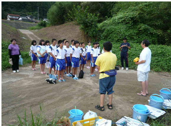
川本中学校1年生18名による水生生物調査