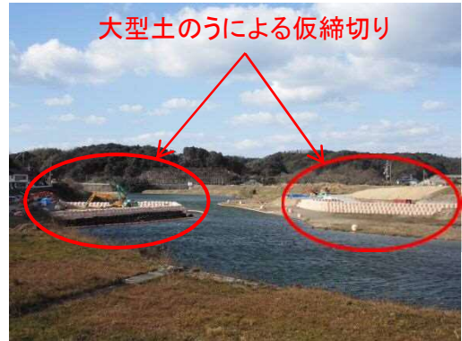
大型土のうによる仮締切り

三隅川橋の下部工事では、三隅川の河川内に橋脚（橋の柱）を施工するため、大型土のうによる河川の仮締切り（施工場所に水が入らないようにする土手）を行っています。仮締切りの完了後、コンクリートの基礎杭を施工し、橋脚の本体施工を行います。