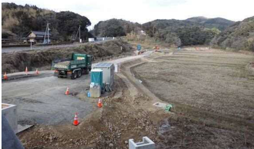
【木部地区改良工事全景】

木部地区改良工事では、国道9号から三隅・益田道路本線の工事場所まで、工事に必要な資材や重機等の搬入、トンネル掘削や切土による残土等の搬出のための工事用道路を施工しています。また、木部川を渡河するための工事用仮橋も施工しています。