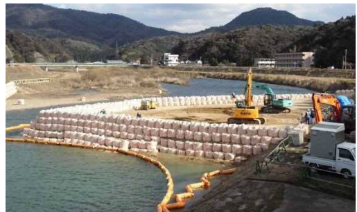
【大型土のうによる仮締切り状況】