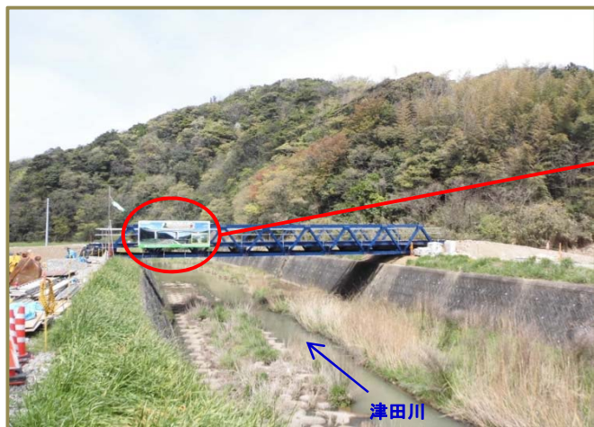
【津田川に架かる仮橋全景】