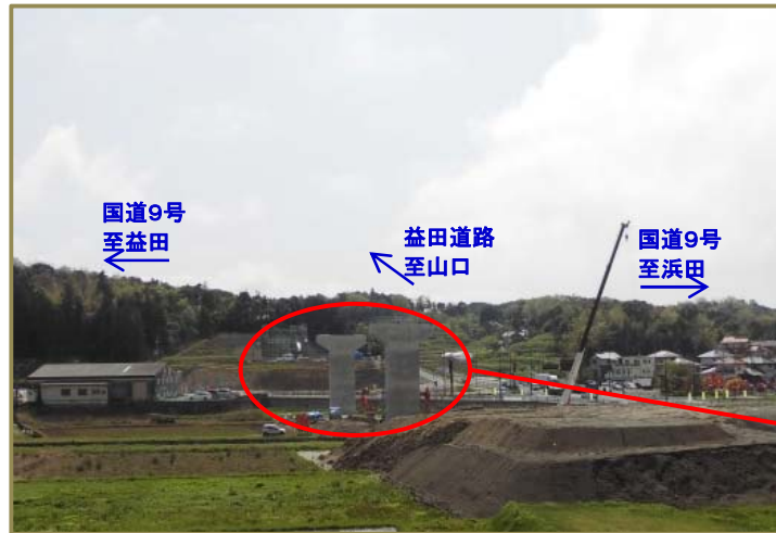
【遠田高架橋下部工事全景】