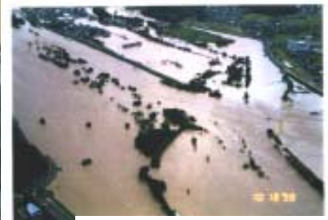
百間川分流部周辺

ピーク時の洪水流量(東西中島地区) = 3,500 \text{ m}^3 / \text{s}