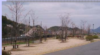
<赤鳥居箇所：桜づつみ>