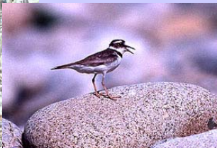
河原の礫地に営巣するイカルチドリ