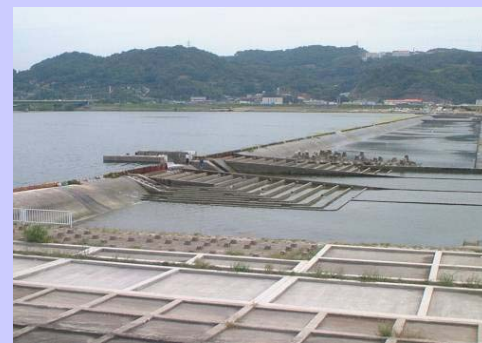
生態系に配慮した施設整備が必要