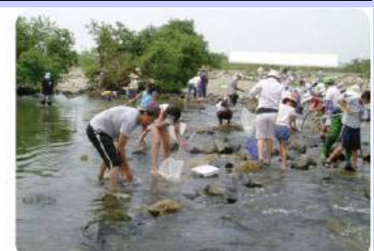
<そうじゃ水辺の楽校>