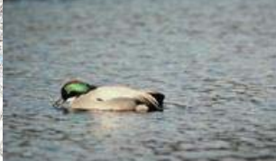
下流の水面に飛来するのカモ類