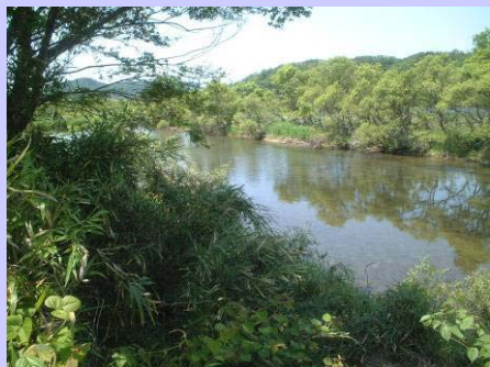
親水性に乏しい水辺