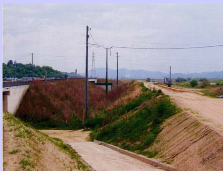
河川との連続性が途絶えている