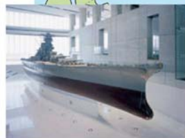
大和ミュージアム