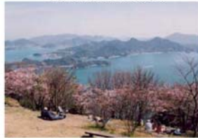
筆影山からの瀬戸の多島美