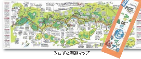
みちばた海道マップ