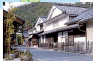
町並み保存地区(頼性清旧宅)