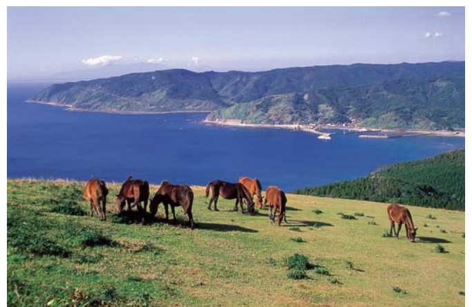
▲勉強会が開催された都井岬に生息する野生馬