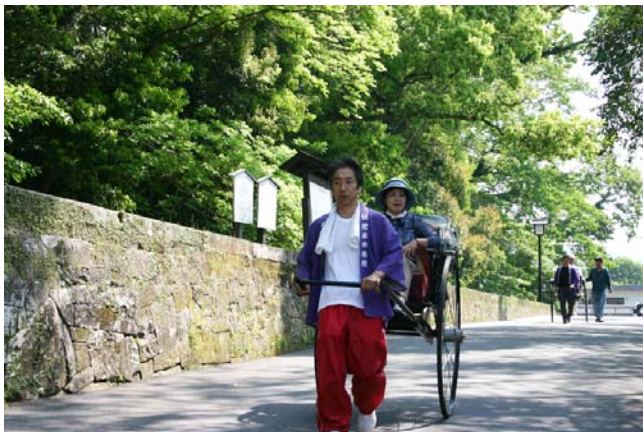
▼日南市飫肥城下町