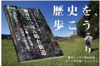
ガイドブックの作成