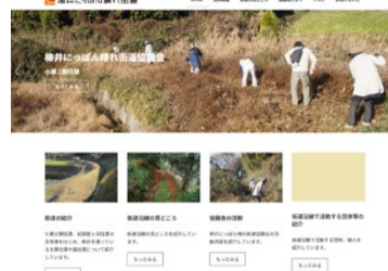
ホームページ作成