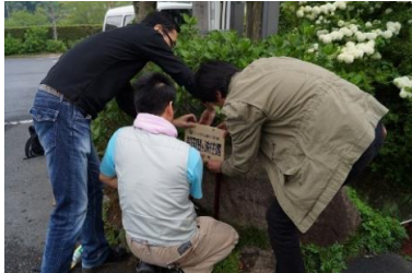
街道標示板の設置