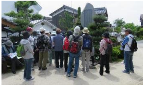
ウォーキングの開催