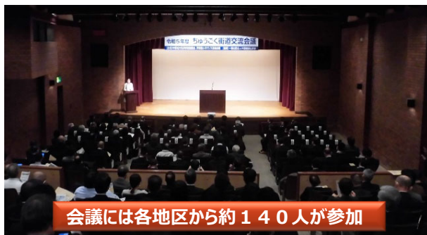
会議には各地区から約140人が参加