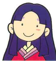
新庄村イメージキャラクター 「ひめっ子」