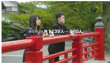
新庄村紹介CM(御幸橋で撮影)

「がいせん桜」は明治39年、宿場町の街道の両脇に日露戦争の戦勝を記念して137本の桜が植えられました。宿場町の桜並木は全国的にも珍しいものです。春はらんまん和咲く花のトンネルとなり、夏は緑いっぱいの青葉で、町並みに木陰をあたえてくれます。秋はまた紅葉となり、真紅に色づく町並木もまた美しく、そして冬になれば雪の花咲く並木となります。両脇にある小川には鯉や水車など昔ながらの風景が残っています。桜から四季を覚えてもらい、歴史・文化も伝えてくれています。昔からそこに有り続け、人々の時間を見守っていく、がいせん桜は時を刻み続けます。