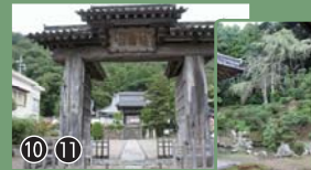
雪舟が住職だった頃、手がけた庭が史跡・名勝として残されています。