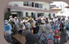
平成26年で第13回。歴史を活かしたまちづくりを目的に史跡を巡るスタンプラリーをしています。中高年から子どもまで幅広い年齢層が参加しています。