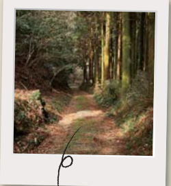
旧山陰道。益田藩と濱田藩の境がこの先にあります。