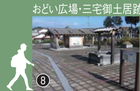
益田氏の館跡。地下に保存されており、タイル表示でその場所が分かります。