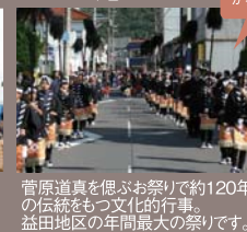
菅原道真を偲ぶお祭り。約120年の伝統をもつ文化的行事。益田地区の年間最大の祭りです。