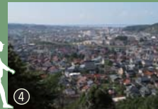
七尾城跡は全長600mの大規模な山城跡で、益田平野と日本海を一望できる位置にあります。