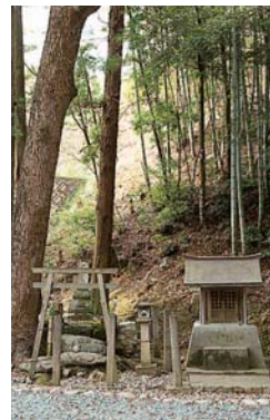
関所を死守し壮烈な戦死を遂げた岸静江国治のお墓

七尾公園の堀割と益田川を掘として築かれたのが「益田氏城館跡」の山城「七尾城」です。城跡からは石州瓦の家並みや日本海が一望できます。