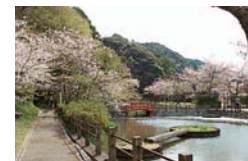
七尾城の堀だった益田水源池

町の中でひときわ目を引くのは、 ぎょうおんじ 暁音寺の山門です。天文12(1543)年に創建、その後この地に移ったと言われています。当時はこの立派な山門と鐘楼が道にせり出し、鍵形に曲がった道は「鍵曲がり」と呼ばれたそうです。