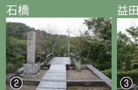
橋の向こうには、妙法寺の室町時代からの門前町が続いていました。