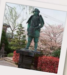
妙義寺の前に立つ15代兼堯の像