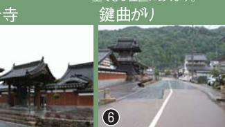
鐘楼と山門が見事です。寺の前は見通しのよい道路に改修されましたが、鍵曲がりの面影が残っています。