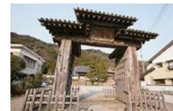
七尾城の大手門だったといわれる「医光寺総門」