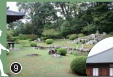
雪舟の手による池泉回遊式兼 観賞式庭園