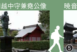
石見の国人領主益田氏当主で第15代益田城城主