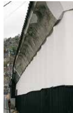
さざ波のような漆喰が美しい小泉本店の厩だった建物

家家老の菩提寺である「海蔵寺」や勇壮なけんか御輿で知られた「草津八幡宮」のふもとを通る道が西国街道です。鷲森神社では境内で歌舞伎が行われ、当時の役者が奇進したのではといわれる手水鉢が残っています。「小泉本店」の二段構えの大屋根は「伊達二階」といわれる平屋で、古くから厳島神社の御神酒を造っている由緒ある蔵