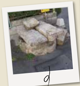
町民の貴重な飲用水だった大釣井。海辺の町では貴重な井戸でした。