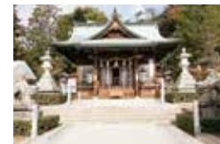
けんか御輿で知られた「草津八幡宮」