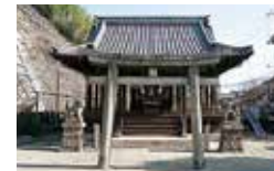
歌舞伎が行われていたという鷲森神社