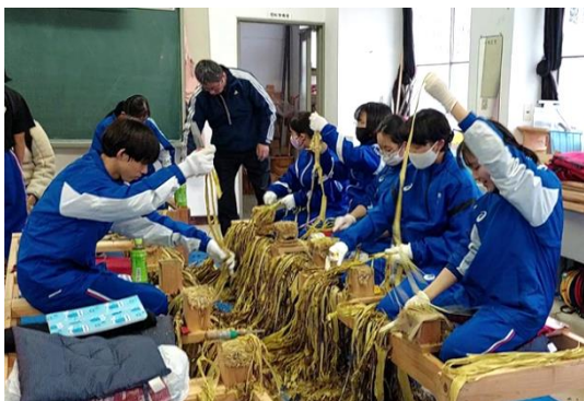
2年生 黒皮剥ぎ作業

岩国市美和中学校では、2016年より地元のボランティアの指導で、1年生は原料三極を植樹と収穫、2年生は皮剥ぎと異物除去、3年生は紙すきで自分の卒業証書を作っている。下級生がコサージュを作った。卒業証書作りは今年で9回目、全国では類を見ない伝統的な行事となっている。