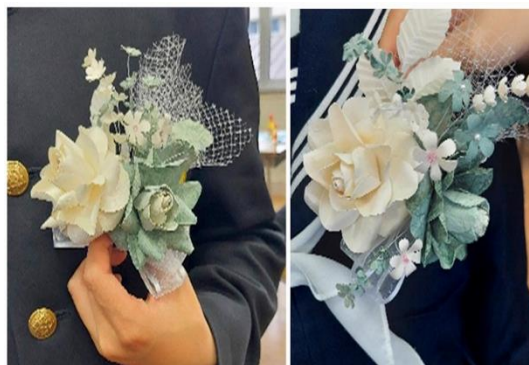
下級生が作ったコサージュ