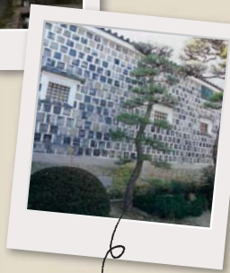
脇本陣のなまこ壁