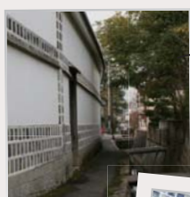
白壁が美しい路地裏