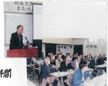
▲ 街道文化を活かしたまちづくり勉強会