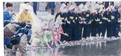
▲ 流しびな水の道を開く儀式