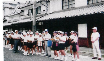
▲ 児童の街並み勉強会