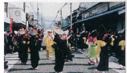
▲ 流しびな行列 神舞