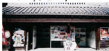
▲ 街並み児童写生展