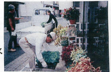
▲ フラワーの花箱配布