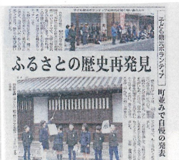
▲ 児童観光ボランティアの新聞記事 (平成24年3月7日山陽新聞)