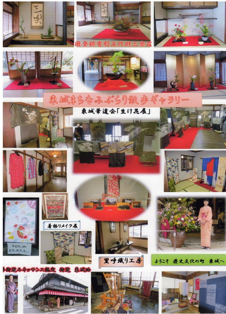
国登録有形文化財 庄原市三楽荘