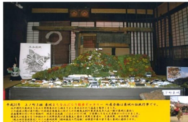
第3回 2008年 城下町東城の箱庭