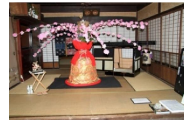
第6回 2011年 江戸時代の修復籠と母衣