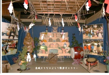
第1回 2006年 比婆荒神神楽 大山供養田植