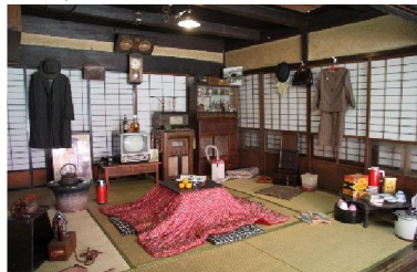
第5回 2010年 よき昭和の冬の茶の間