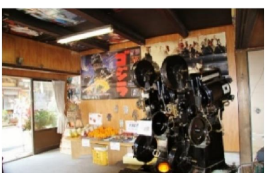
第7回 2012年 囲炉裏と障子に映写 映画ポスター展示