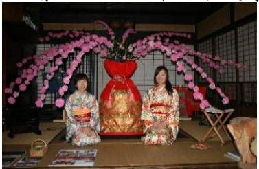
第4回 2009年 手作り母衣