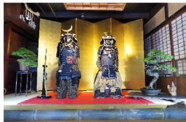
第9回2014年 由緒ある甲冑