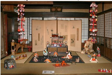
第5回 2010年 御殿雛と春の宴