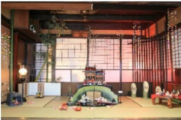
第4回 2009年 竹細工とお雛様