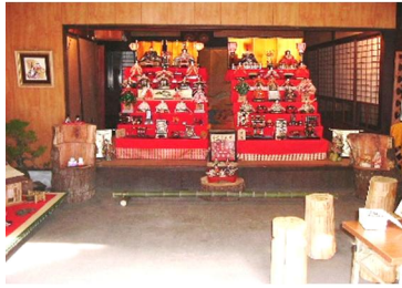
第1回 2006年 ひなまつり