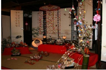
第3回 2008年 折り紙さげもんとお雛様 明治雛