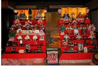
第2回 2007年 ひなまつり