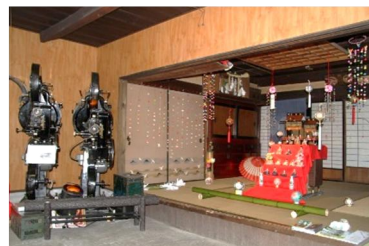
第7回 2012年 手まりと御殿雛