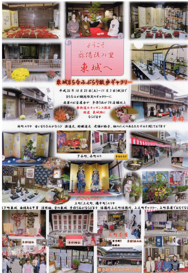
2014年東城まちなみぶらり散歩ギャラリーの様子