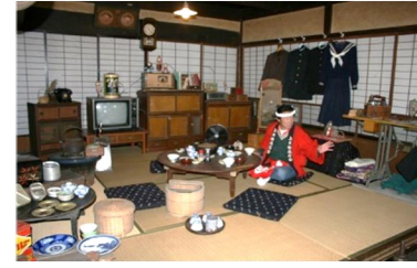
第2回 2007年 よき30年代の茶の間