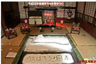
第6回 2011年 がんばろう!日本 籠の中のお雛様