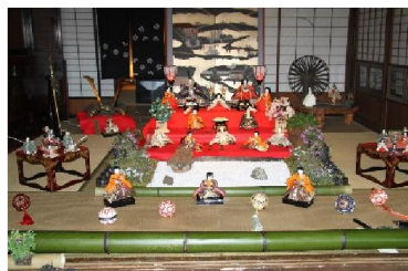
第8回 2013年 芝桜と備後砂庭園お雛様