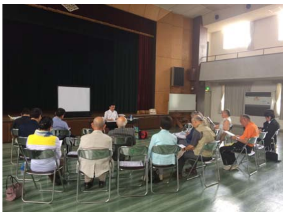
『ふるさと長府知っちょるかね講座』