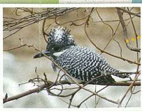
カワセミ・ヤマセミの見えるスポット