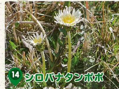
14 シロバナタンポポ

平成21年、仏像研究家が鑑定したところ、頭頂部に鳥居が乗せられており、弁財天と分かった。現在は三田集会所に安置されている。