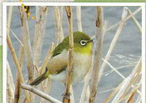
メジロのいるスポット