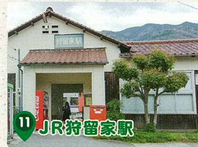
11 JR 狩留家駅

水車を利用した油絞産業は、江戸時代、狩留家に繁栄をもたらした産業の一つである。その繁栄のシンボルとして平成26年に水車を再建した。