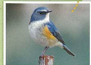
ルリビタキのいるスポット