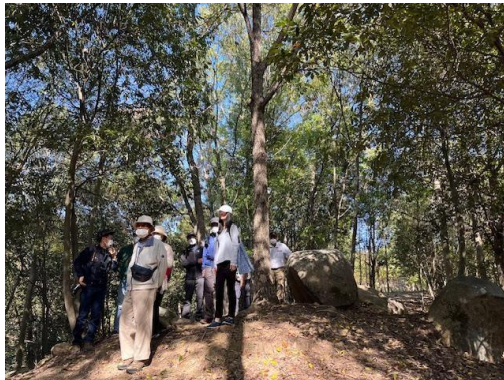
古墳群で説明を聞きながら散策