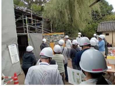
廉塾保存修理工事説明会の廉様子