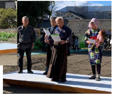
朗読劇 (菅茶山城を辞す)