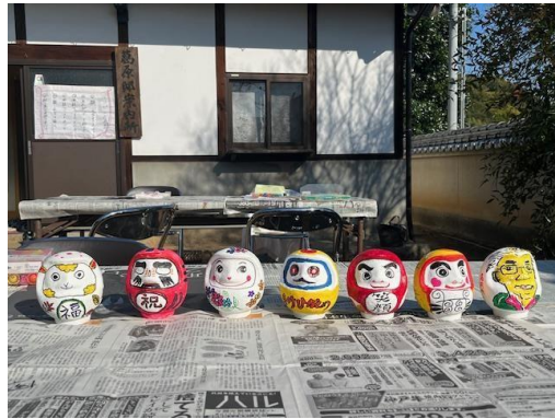
ニコピンだるま絵付け体験