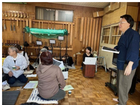
文化財の修復 について説明を聞く