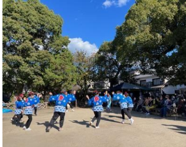
おどり隊による披露

主催：神辺町観光協会 協賛：山形文化財協会 神辺町商工会 神辺文化会 神辺文化協議会 菅茶山顕彰会 尾形文化保存会 西福寺 廉塾ふれあいボランティア研究会 (R5年度)