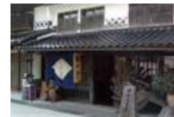
無料休憩所「頼山亭」