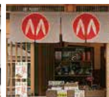
左は中華料理店、右は履き物屋

しょう。風景や伝統の踊りなど勝山らしいものからその店をイメージする商品まで、おしゃれなデザインが目を引きま