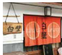
店や民家にかかる風情あるのれん