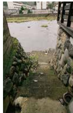
旭川に続く路地があちこちにあります。

た。今も石畳の発着場の跡が残っています。良質の材をふんだんに使った重厚な建物の造り酒屋、なまこ壁や格子窓が美しい商家、見事な てえ 襷絵のある蔵など、往時の面影を伝える古い家々の軒先には、それぞれに意匠を凝らした「のれん」が掛けられ、町並みにいっそうの風情を添えています。しっとりと落ち着いた色合いの町に、商店だけで