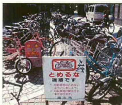
自転車やバイクが路上にずらりと並んだ市道＝表町