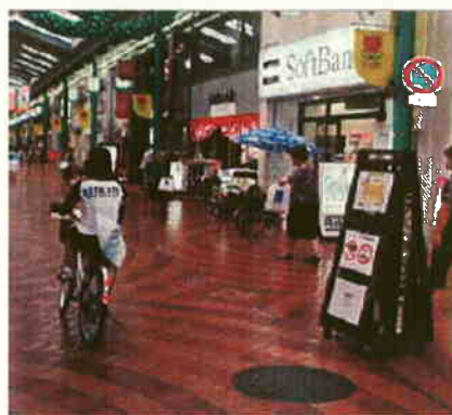
「目安箱」で最も苦情の多かったアーケード内の自転車通行