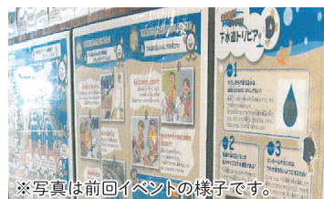
※写真は前回イベントの様子です。

CLiP HIROSHIMA (会場) 内にて「広島湾におけるSDGsの推進」をテーマにしたパネルを展示!