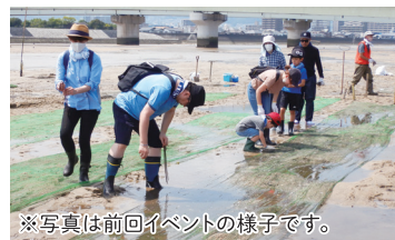
※写真は前回イベントの様子です。

「海岸ごみ清掃」「広島湾の魅力マップづくりイベント」など、様々な体験イベント開催を予定!