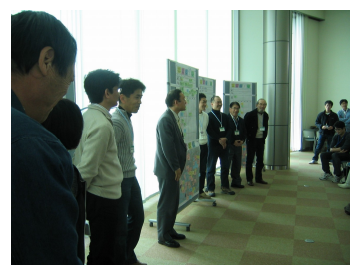
海は人により育てられ、また人も海により育てられてきた...これはまさに発見! 素敵な言葉を教えて頂きました。