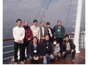
～ 2班のアノ日のきろく ～

船長・館長 ことばがイイ! 農水産物の生産者 春先になると魚を売ってる人 地域カルチャーを 先導してくれる人