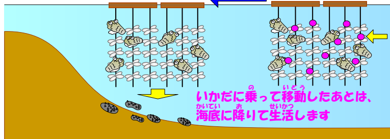
なまこの赤ちゃん