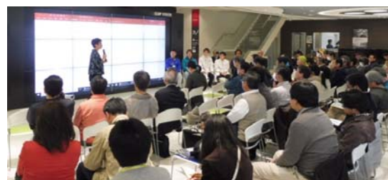
トークセッション状況