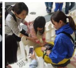
ペンギンに触ろう