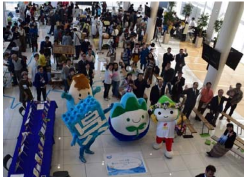
みんなで記念写真