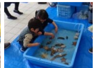
タッチングプール