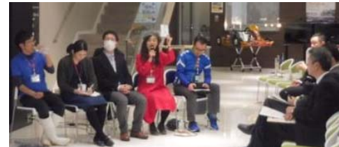
トークセッション状況