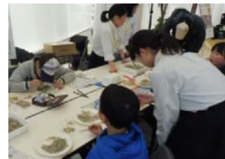
ちりめんモンスターを探せ