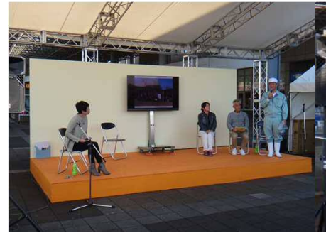
パネラーからの話題提供