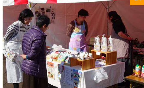
広島湾のさとやま・さとうみの幸の販売