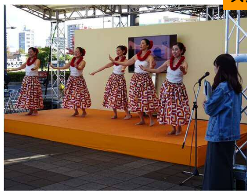
フラダンス（ひろしまみなとマルシェとのコラボ）