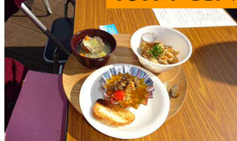
オリジナルレシピ（3品）