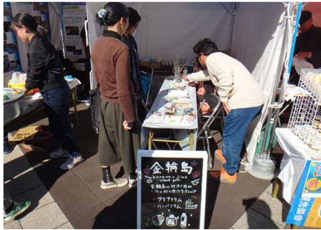
アロマストーン、ハーバリウムづくり