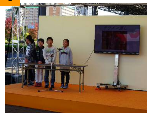
チリメンジャー活動報告（呉市波多見小学校）