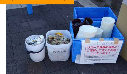
リユース食器の利用