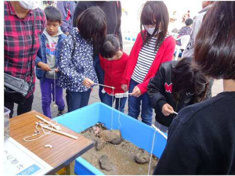
干潟の生き物との触れ合い