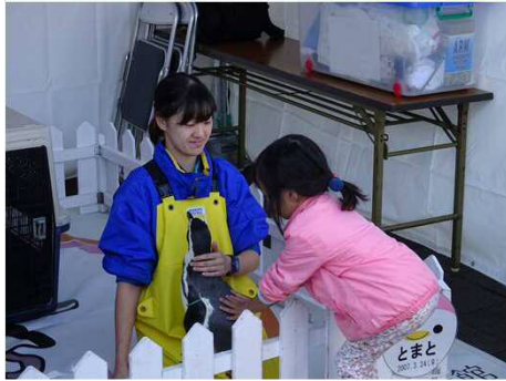
ペンギンふれあいコーナー（宮島水族館）