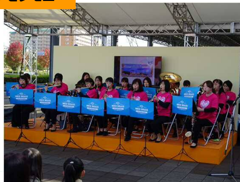
吹奏楽演奏（MKU吹奏楽団）