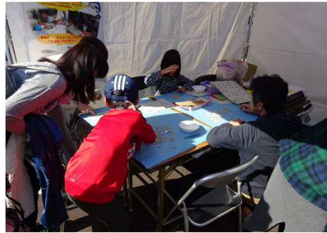
チリメンモンスターを探せ