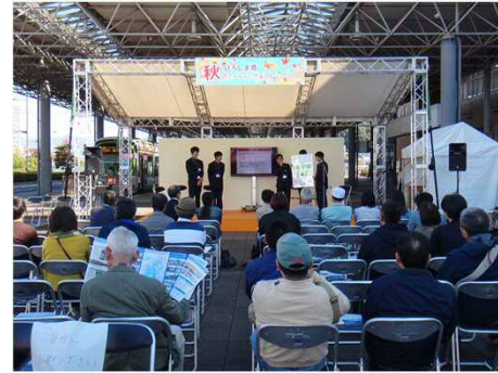
広島湾さとうみ創生コミュニティのプロジェクト活動報告