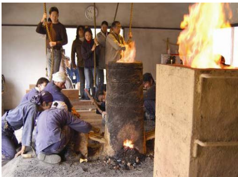
【国選定技術者・ボランティア等の協力による「古代たたら鉄づくり体験」】