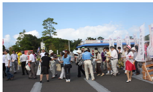
【「神話博しまね」における庄原市と連携したPR活動】

なお、管理運営の実施にあたっては、引き続き利用者の安全確保、サービス向上を図りながら、コストの縮減に努めます。