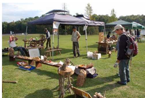
【庄原市との共催による地域交流イベント 「さとやま手作りアートフェスタ」】