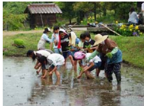
【地元老人クラブの協力による体験プログラム】