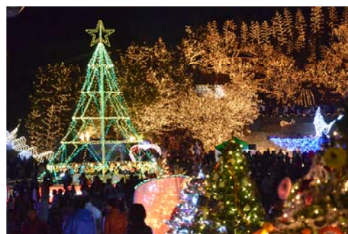
ウィンターイルミネーション