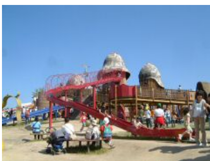
【障害者と健常者がともに遊べる 大型複合遊具】