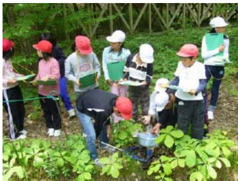
【地元小学校と協働で整備した ビオトープでの生物調査】