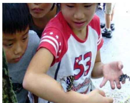
【オオムラサキの保護・繁殖の取り組み】