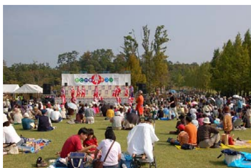
【庄原市との共催による地域交流イベント 「さとやま夢まつり」】