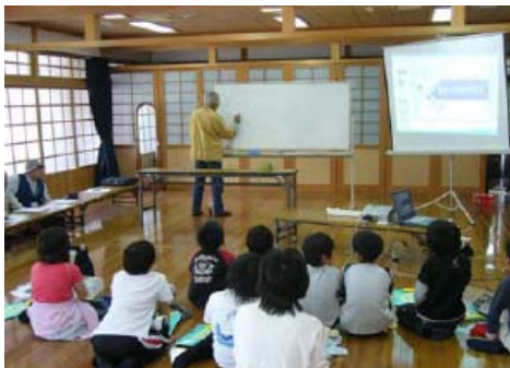
【ガイドボランティアによる 自然観察会】