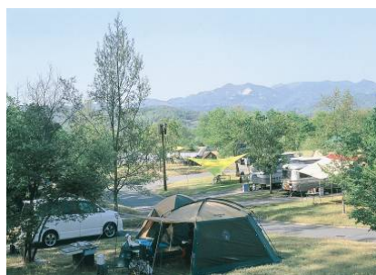
星の里 オートキャンプ場