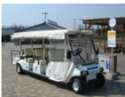
【シルバー・障害者等優先の 無料園内移動施設】