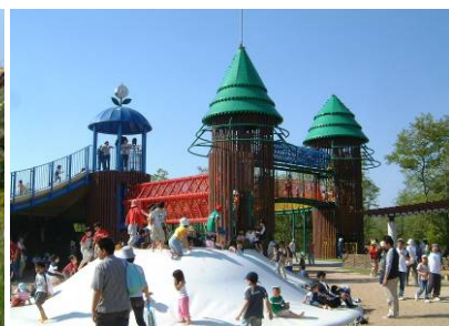
つどいの里 きゅうの森