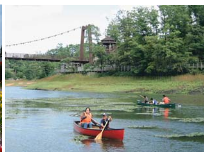
水辺の里国兼池 カヌー体験