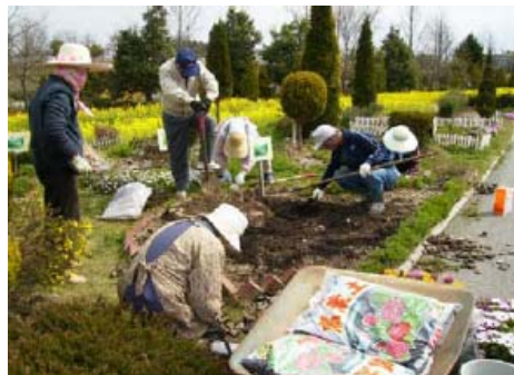
【ボランティアによる花壇づくり】