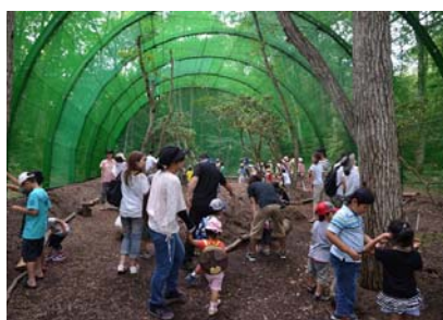
いこいの森 カブトムシドーム