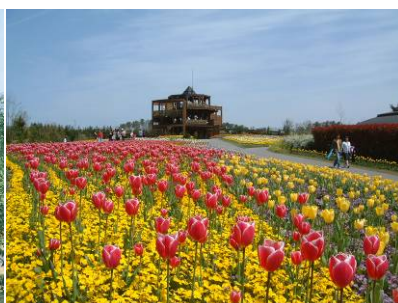
中入口センターエリア 花の広場