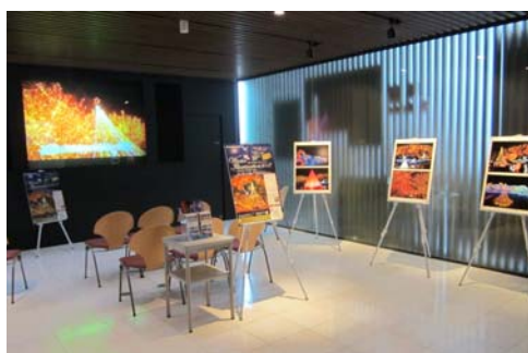
【大和ミュージアムにおけるポスターの展示】

四季を通じた多彩なイベントの開催時においては、マスメディアへのタイムリーな情報発信や、チラシ、ポスター、リーフレットの配置・配付を行うとともに、地元自治体や他の観光施設と連携した広報活動を実施します。また、ホームページ等にも掲載し、積極的な広報を実施します。