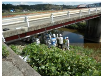
整備局職員による説明状況

現地では取材があり、NHK朝(10/8)のローカルニュースでの放送及び中国新聞の朝刊(10/8)への記事がありました。