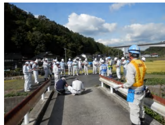
いわかわ 現地実習(岩川橋)