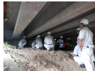
にっこうじ 現地実習(日光寺橋)