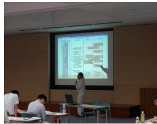
橋梁点検の着眼点 (錦織技術情報管理官)