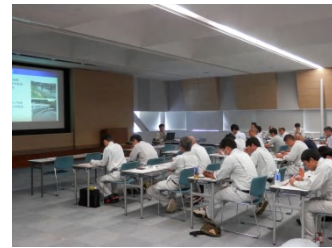
橋梁点検実習方法について

現場実習では、三次市の管理する「岩川橋」「日光寺橋」にて橋梁損傷のメカニズム・点検のポイントについて橋梁保全アドバイザーや整備局職員より学び、橋梁点検調書への記入方法の実習を行いました。