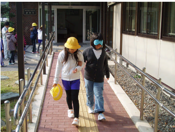
視覚障害者擬似体験