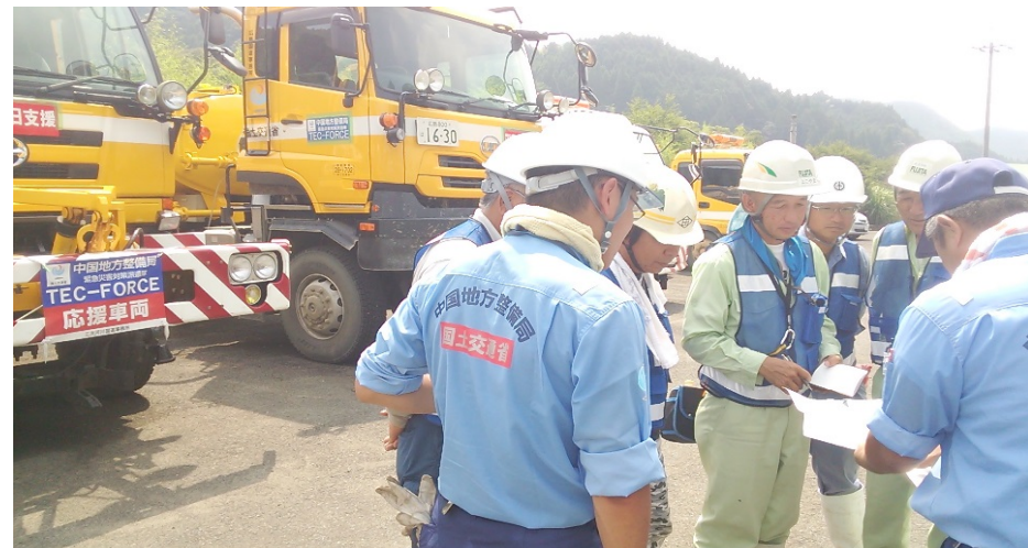
【対策班】国道211号の道路散水 災害協定企業との打合せ(現地)