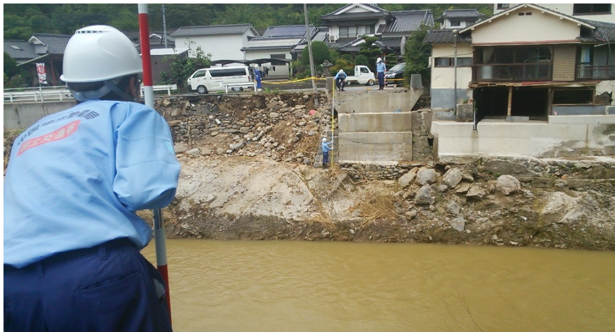
【道路②】日田市 市道調査状況 (夜明橋 橋台調査)