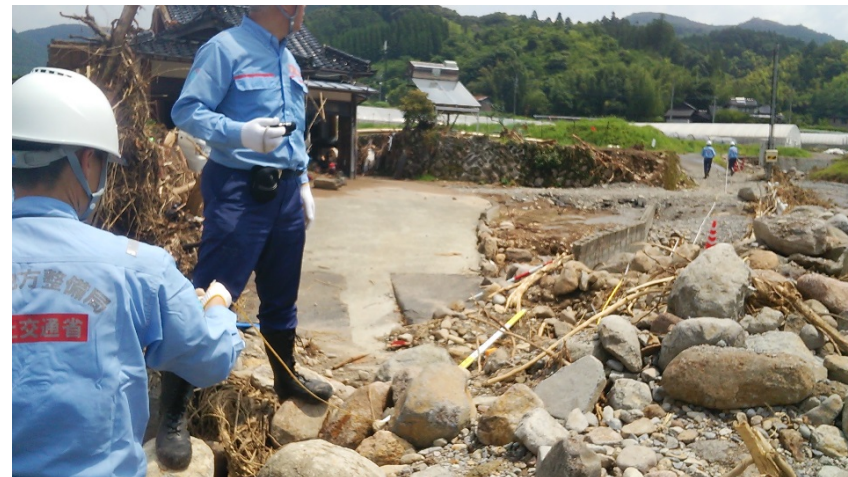
【道路②】日田市 市道調査状況 (一夕線 路線被災・堆積調査)