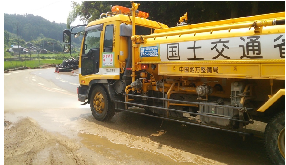
【応急対策班】道路散水状況