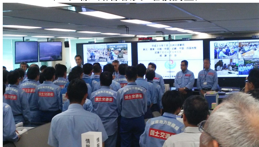
【司令部②】TEC隊への感謝の会 (局長挨拶、中部地整隊長答礼)