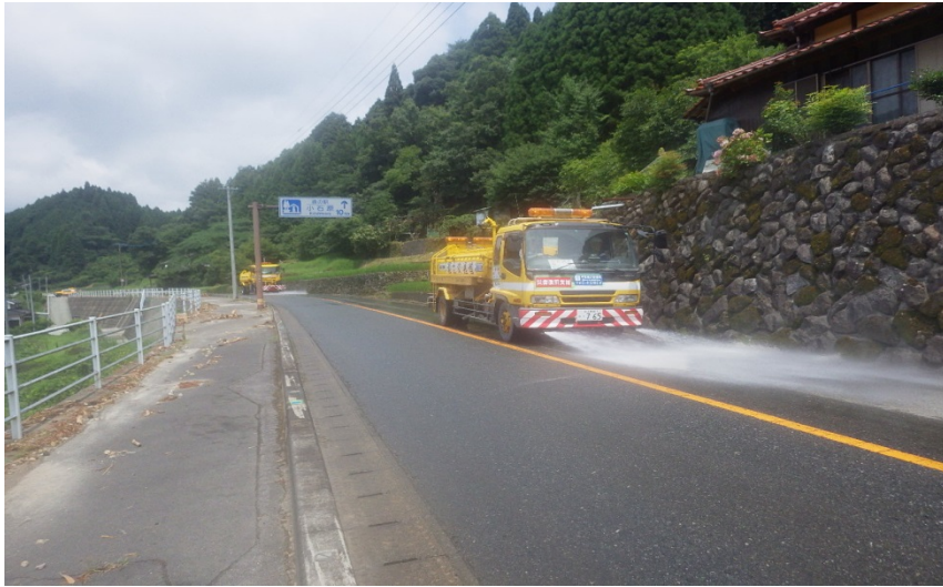
【応急対策班】道路散水状況