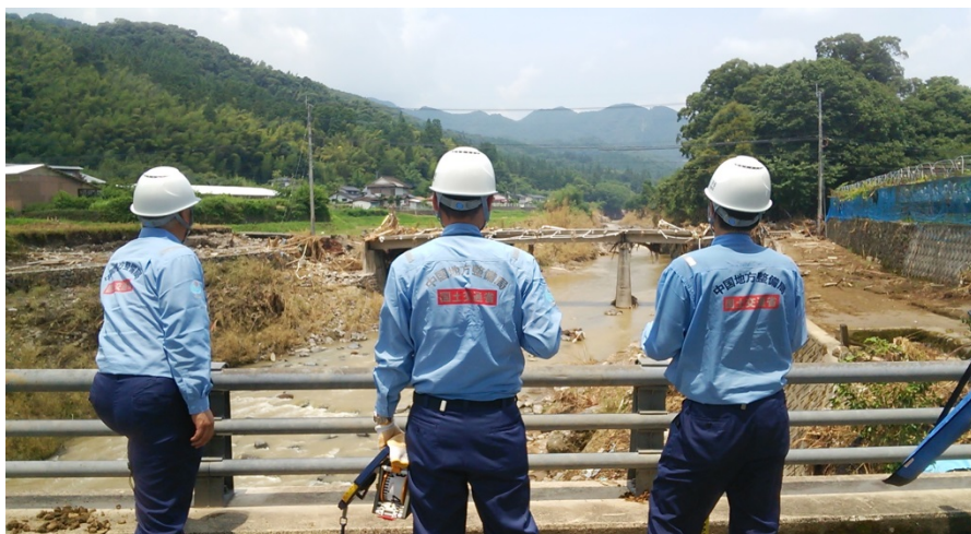
【道路②】日田市 市道調査状況 (茶屋の瀬橋 損傷調査)