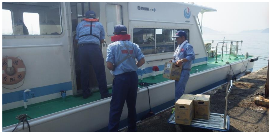
港湾業務艇『洲浪（しまなみ）』へ緊急物資の積込状況