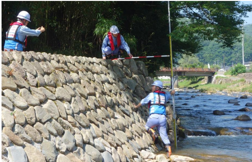
被災状況調査(吉備中央町)