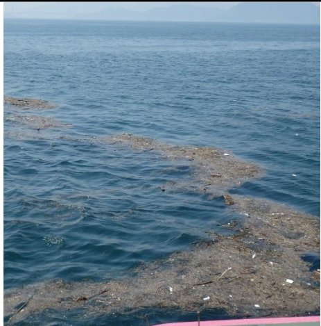
漂流物の状況（因島付近）