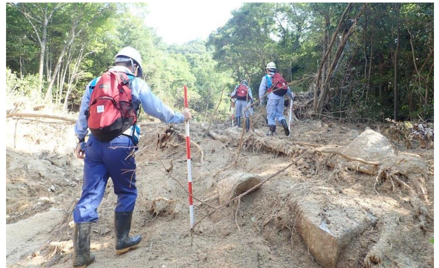
被災状況調査(呉市)