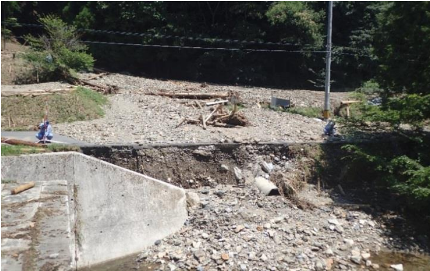
被災状況調査(呉市)