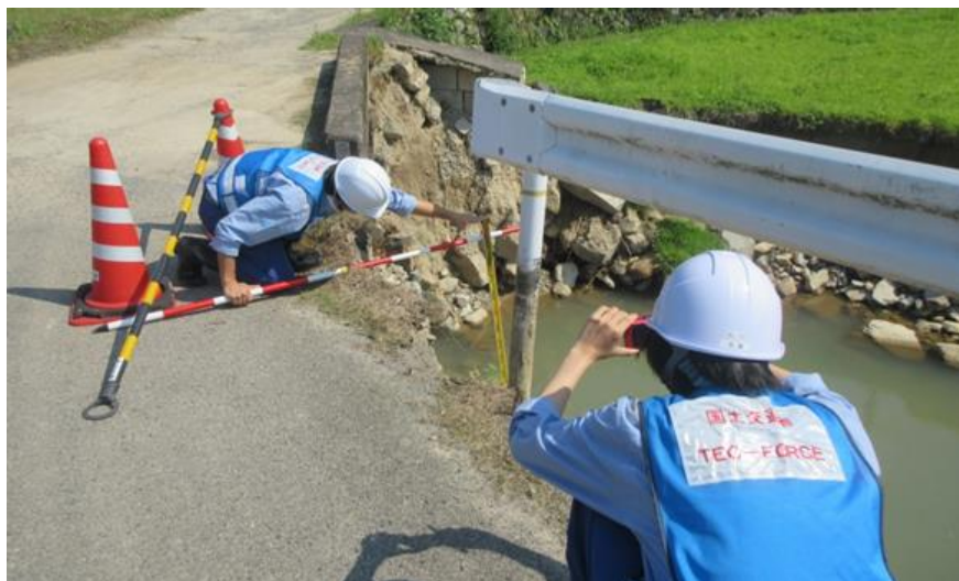
被災状況調査(東広島市)