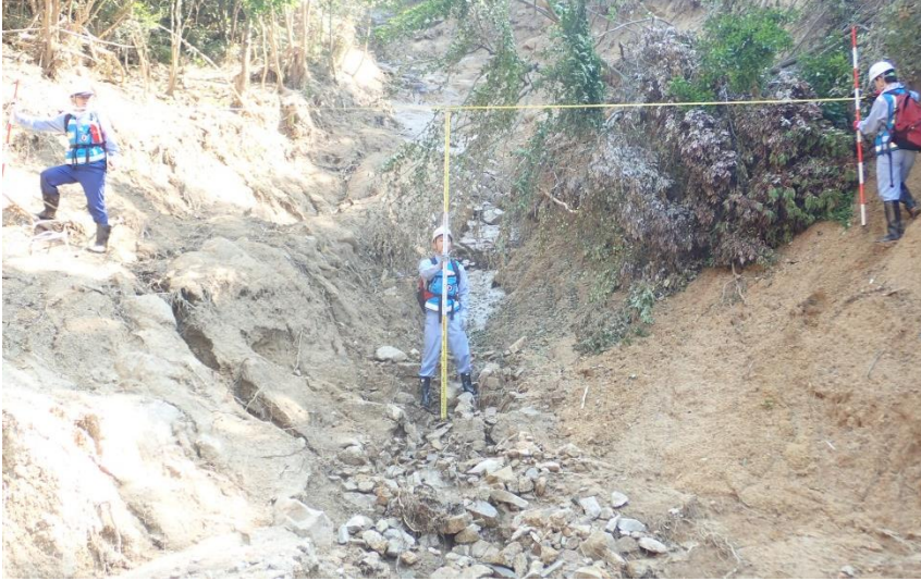
被害状況調査(新見市)