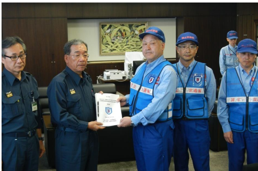
東広島市 高垣市長への調査結果の報告