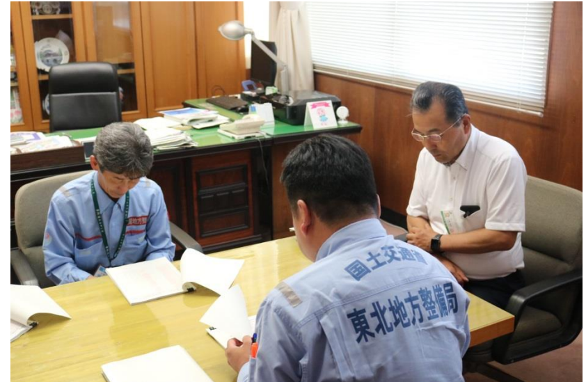
赤磐市 友實市長への調査結果の説明