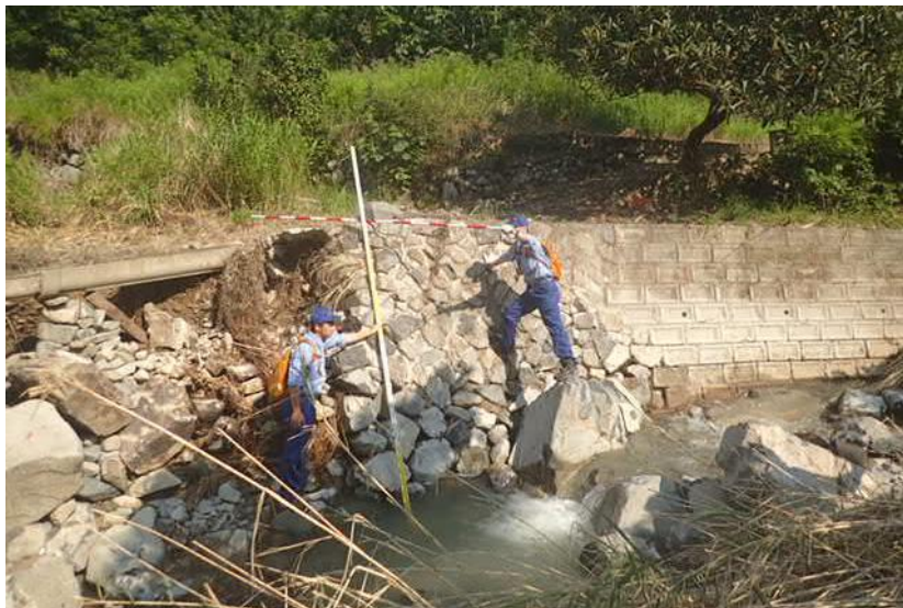
被災状況調査(東広島市)