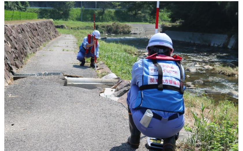
被災状況調査(吉備中央町)