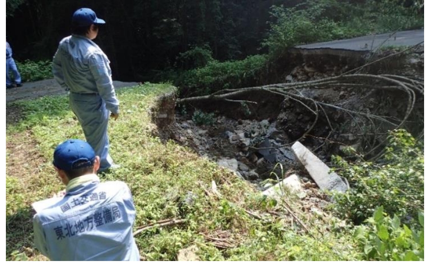
被害状況調査(新見市)