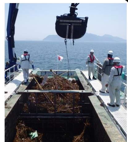
漂流物回収状況（流木・葦等）