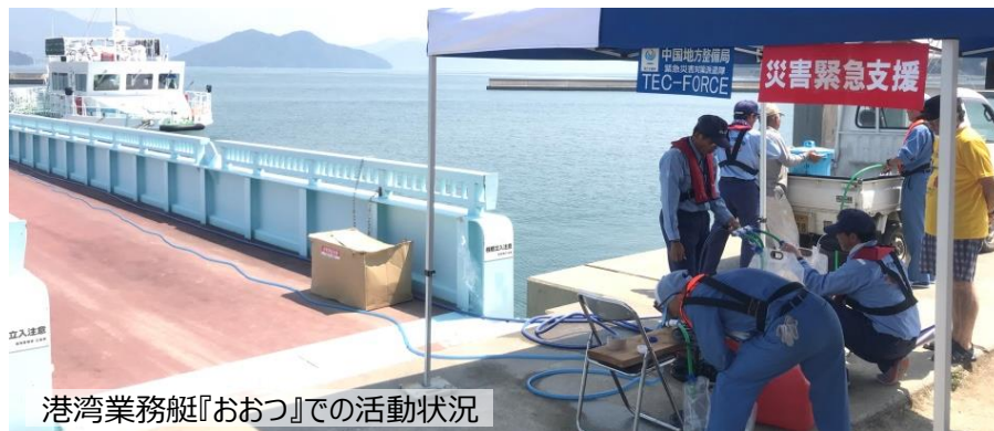
港湾業務艇『おおつ』での活動状況

（呉市）呉港阿賀マリノポリス地区岸壁（水深7.5m）において中国地整所属『おんど2000』及び九州地整所属『がんりゅう』の2隻、（呉市）蒲刈港では港湾業務艇『おおつ』により給水支援。