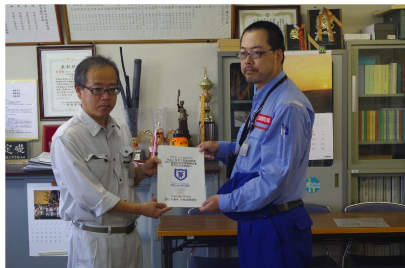
広島県 三原支所長への調査結果の報告