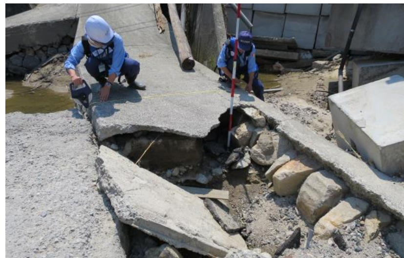
被災状況調査(熊野町)