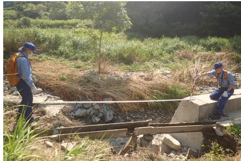
被災状況調査(東広島市)