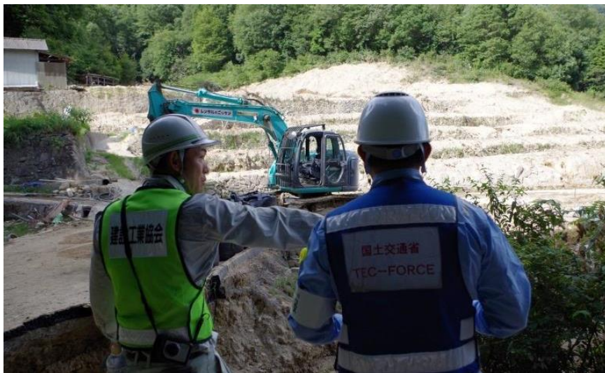
道路啓開(呉市安浦町)