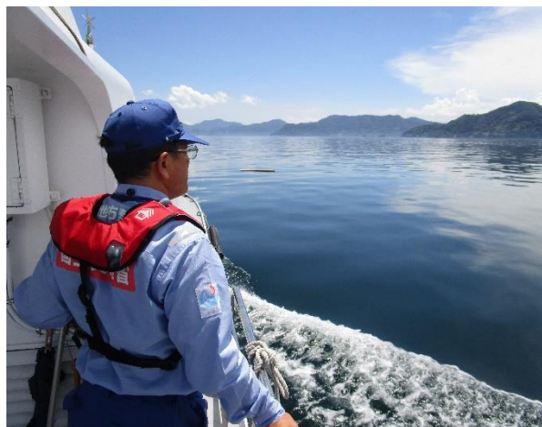
港湾業務艇による漂流物の状況調査