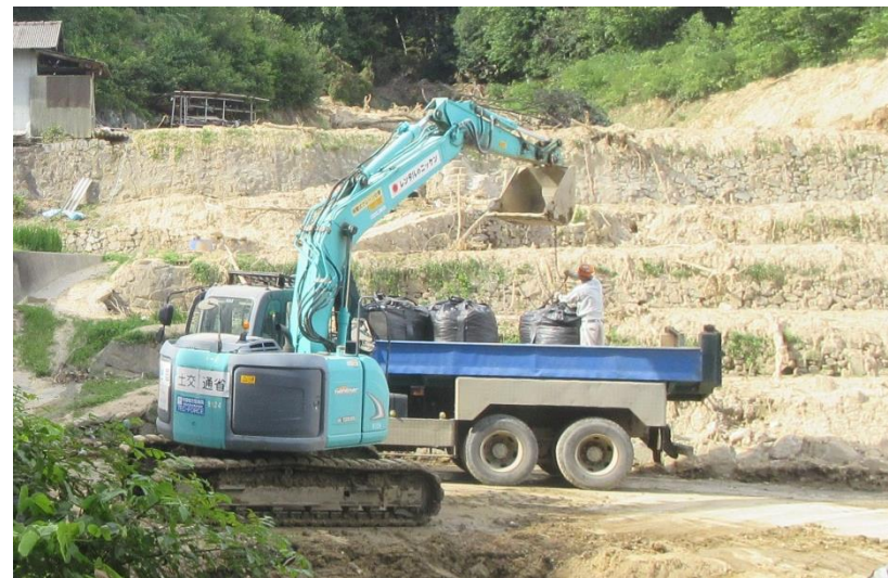
道路啓開(呉市安浦町)