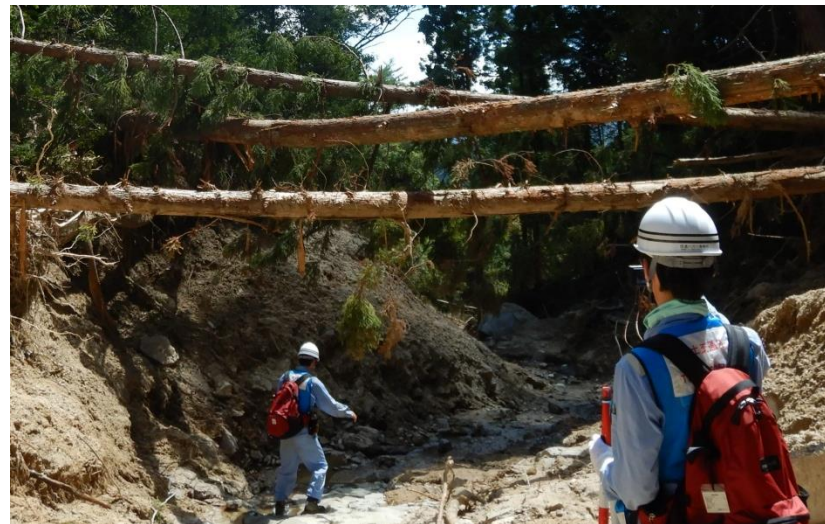
被災状況調査(熊野町)