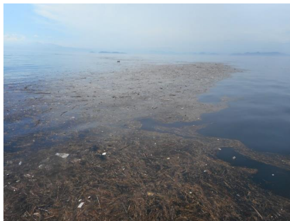
蒲刈港（呉市）沖合の漂流物状況