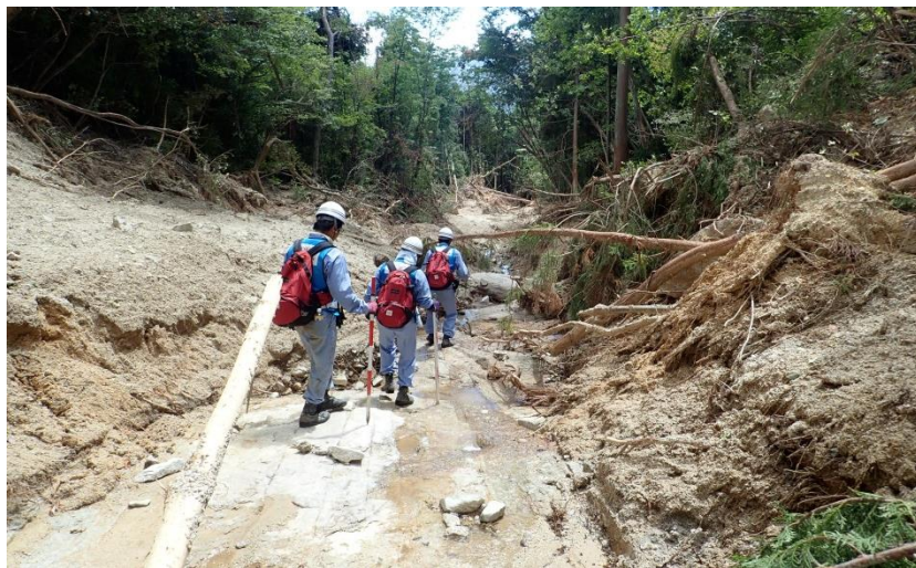
被災状況調査(熊野町)