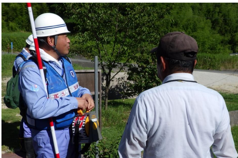
地元住民からの聞き取り(熊野町)