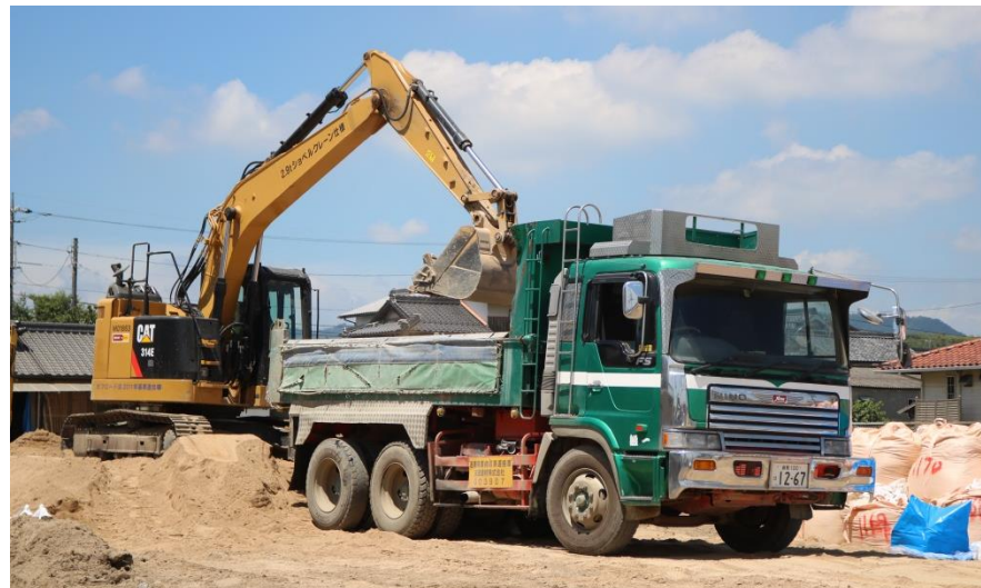
水路啓開作業（倉敷市真備町）