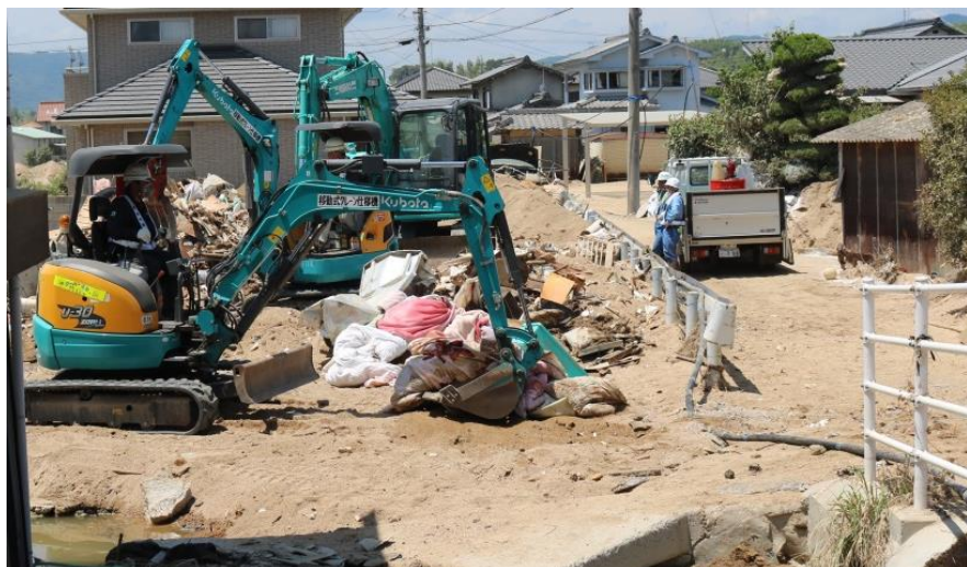
水路啓開作業（倉敷市真備町）