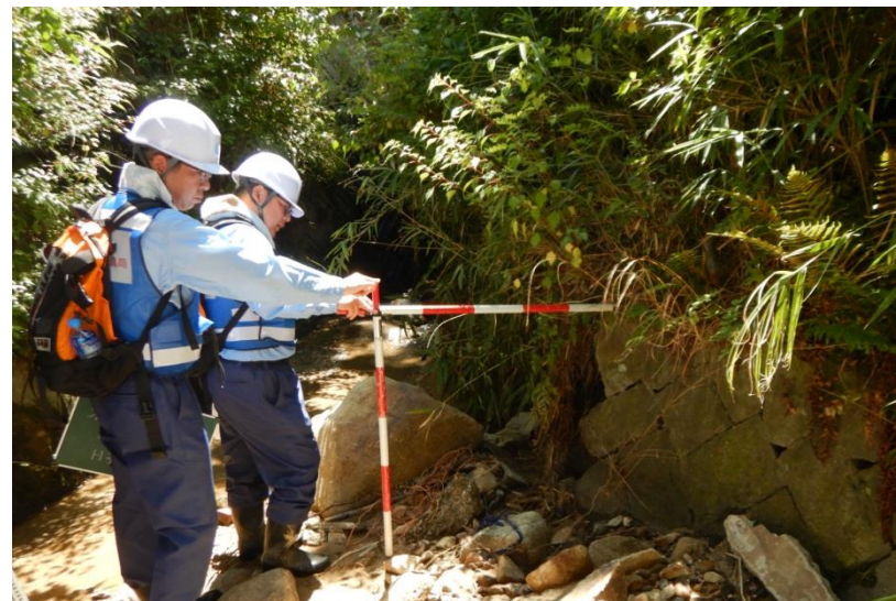
被災状況調査(東広島市)