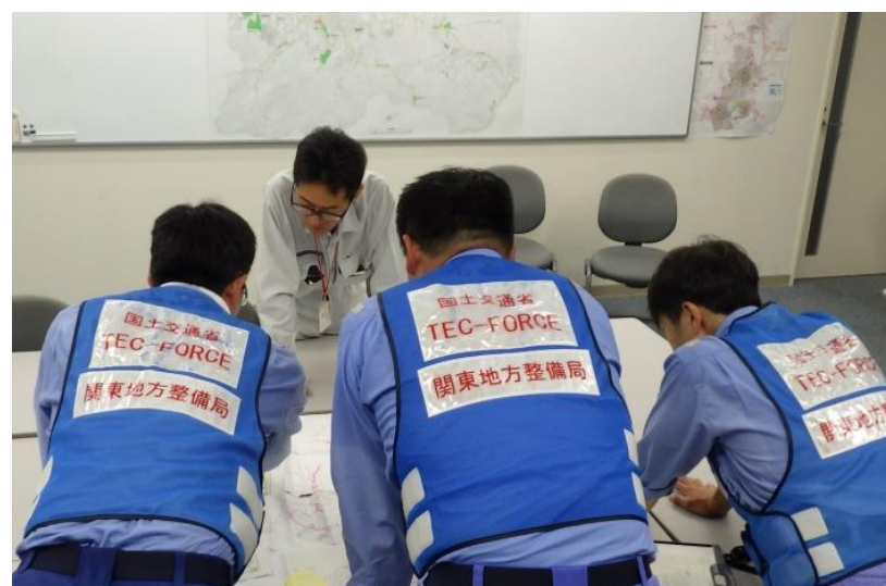
熊野町担当者との打合せ(熊野町)