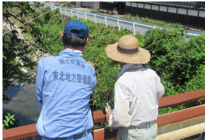
地元住民からの聞き取り(東広島市)