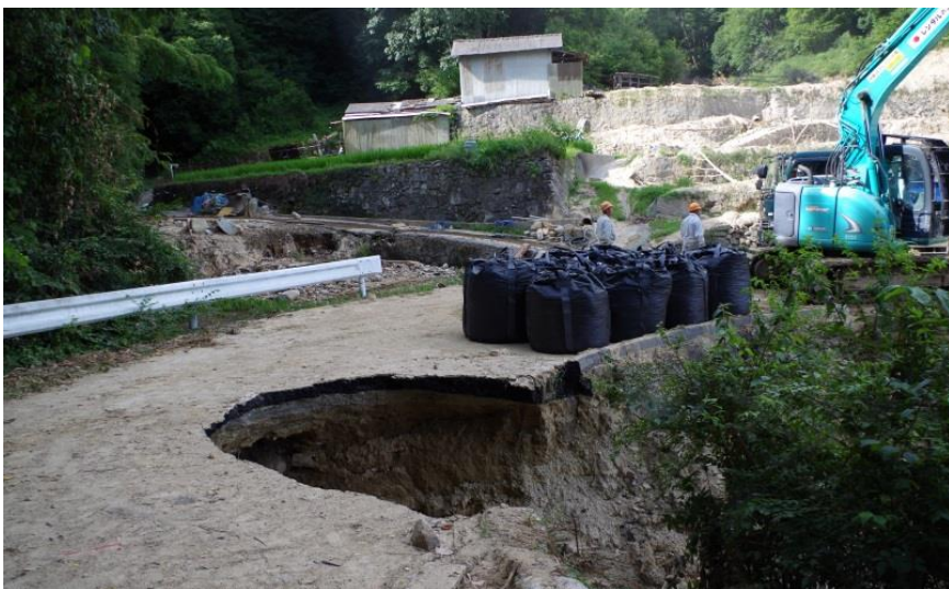
道路啓開(呉市安浦町)