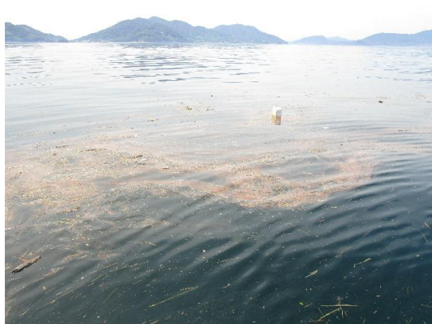
漂流物の状況調査（大崎下島沖合）