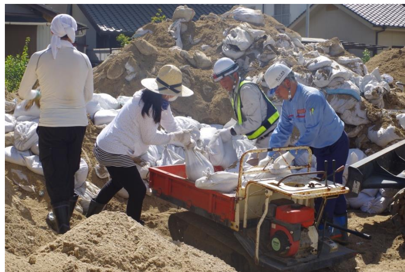
道路啓開(安芸郡坂町小屋浦)