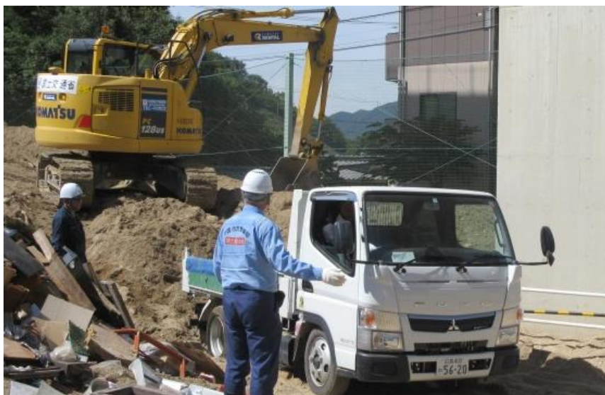
道路啓開(安芸郡坂町小屋浦)