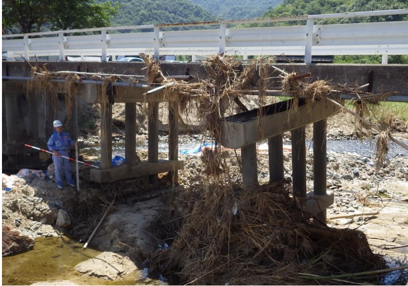
被災状況調査(矢掛町)