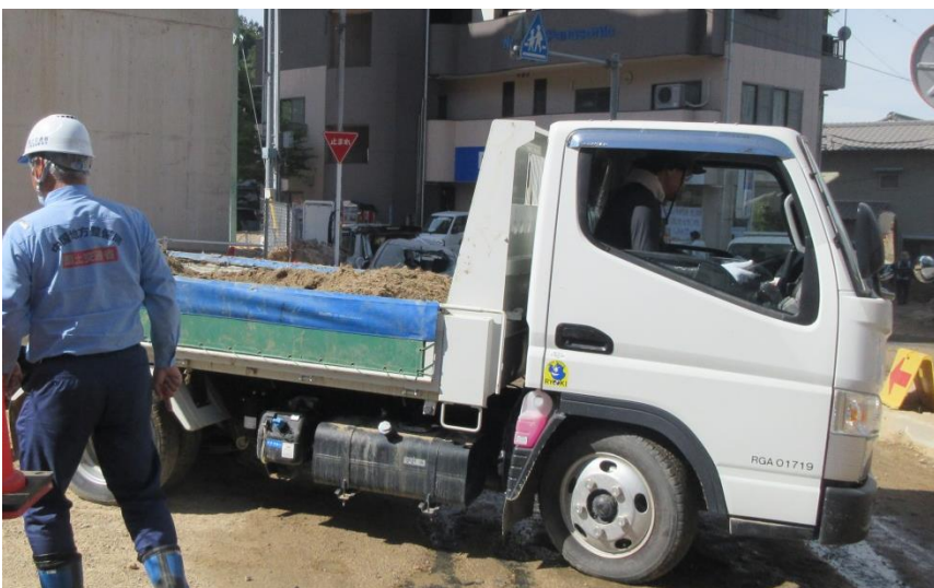
道路啓開(安芸郡坂町小屋浦)