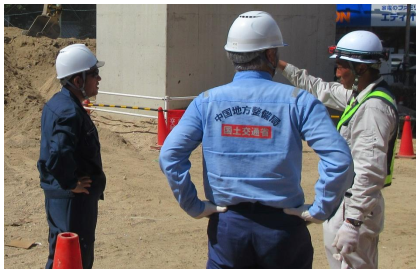
道路啓開(安芸郡坂町小屋浦)