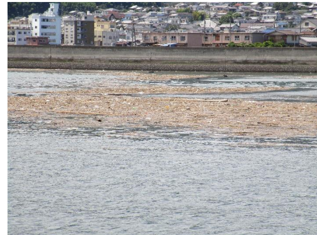
漂流物の状況調査（川尻港沖合）