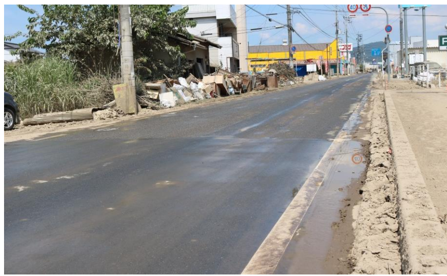
散水作業終了(倉敷市真備町)