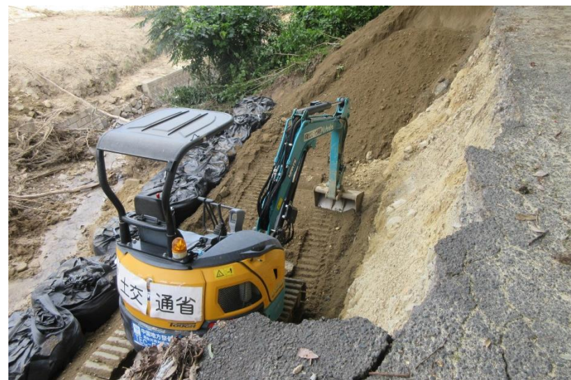
道路啓開(呉市安浦町)