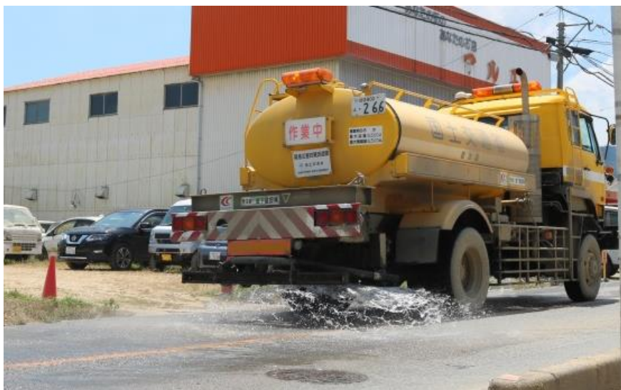
散水作業(倉敷市真備町)