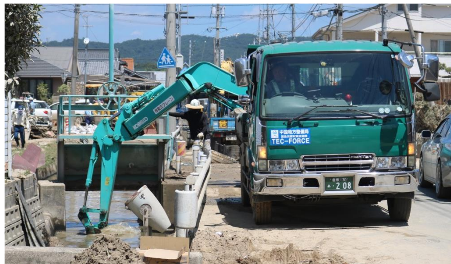
水路啓開作業（倉敷市真備町）