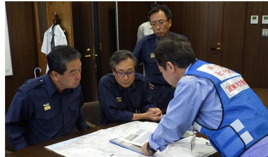
関東地整から東広島市副市長へ調査結果の報告