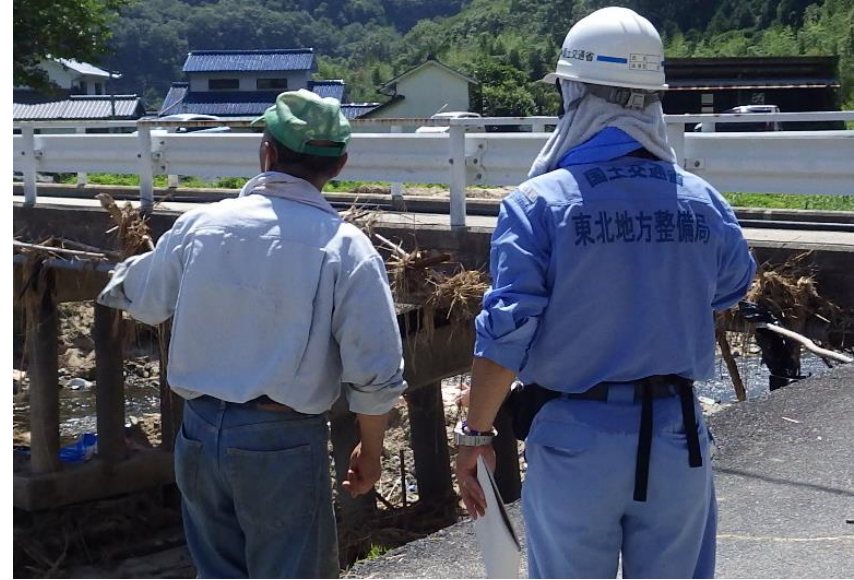
地元住民からの聞き取り(矢掛町)