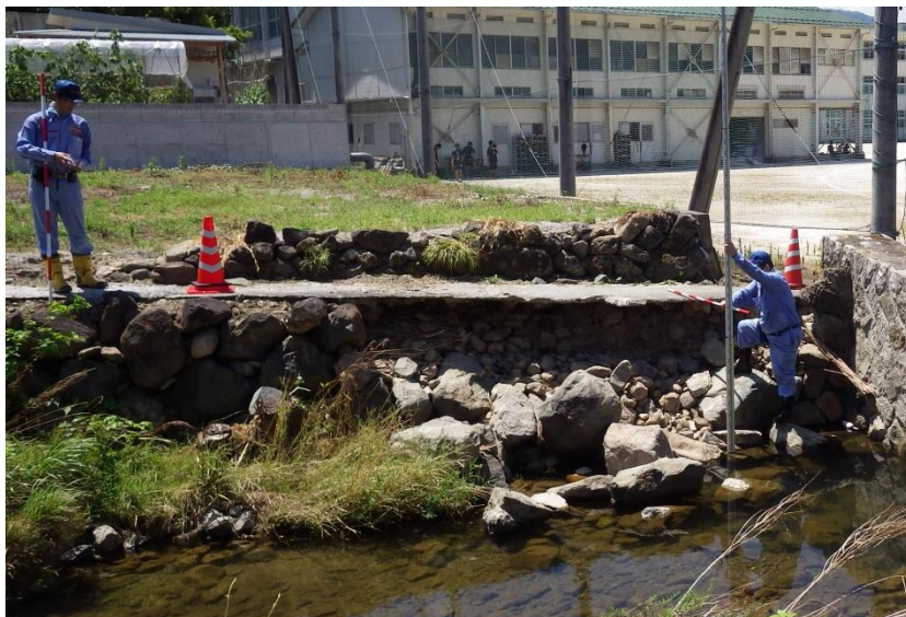
被災状況調査(東広島市)