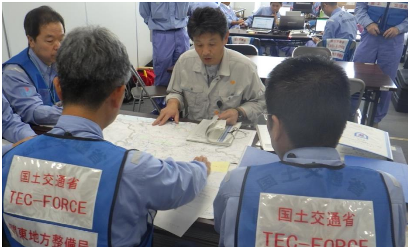
関東地整から東広島市へ調査結果の報告