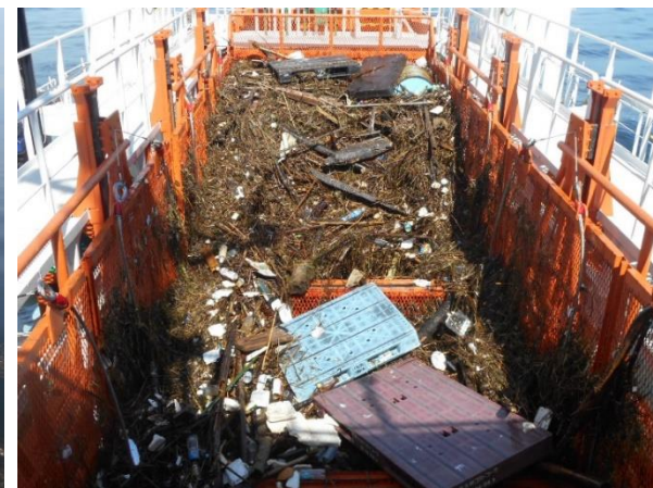
漂流物の回収状況