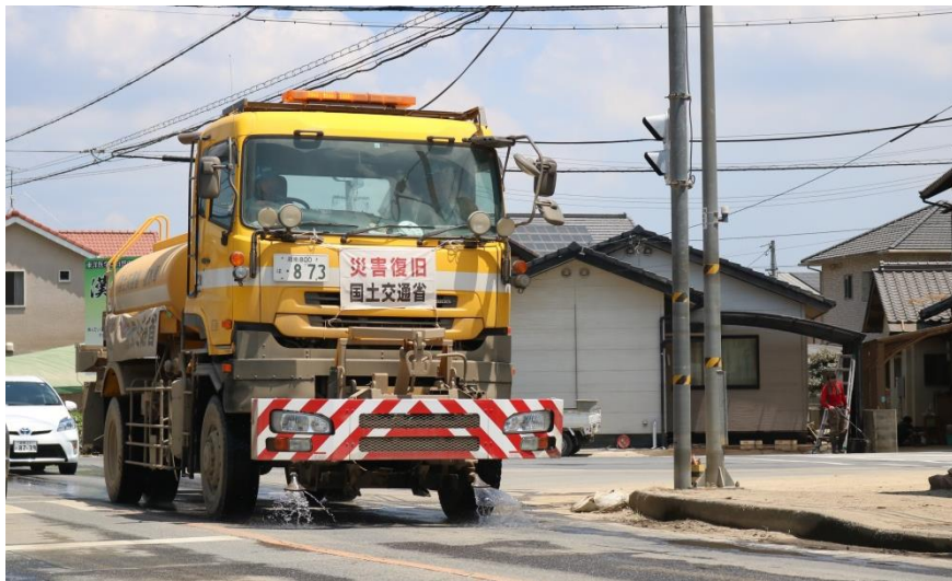
散水作業(倉敷市真備町)