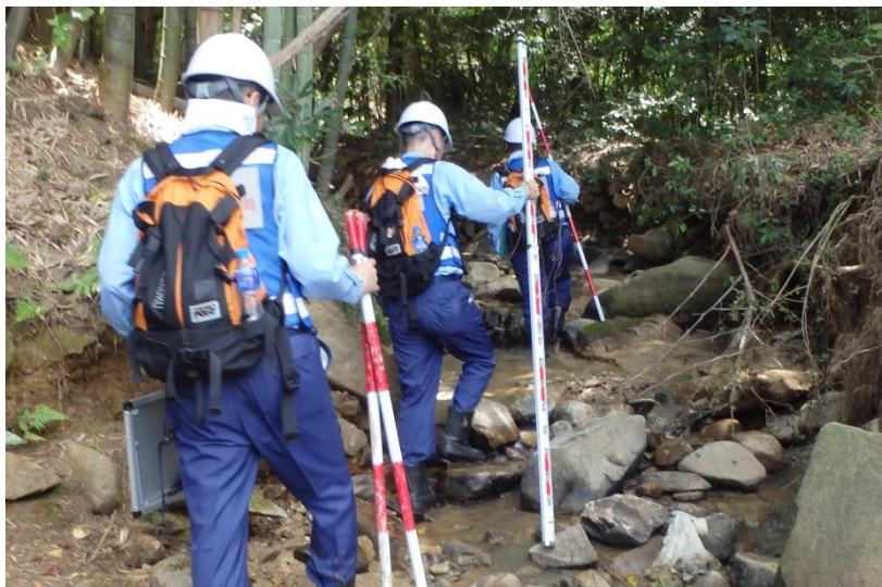
被災状況調査(東広島市)