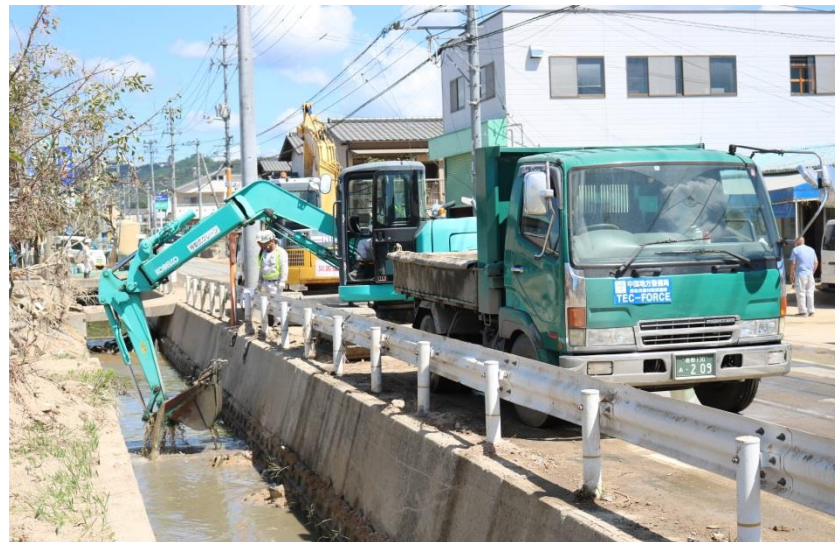
水路啓開作業（倉敷市真備町）