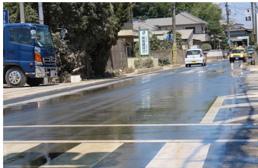
散水作業終了（倉敷市真備町）