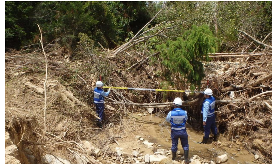
被災状況調査(東広島市)