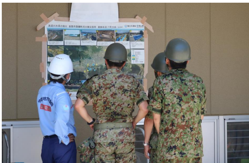
掲示状況(真備総合公園)