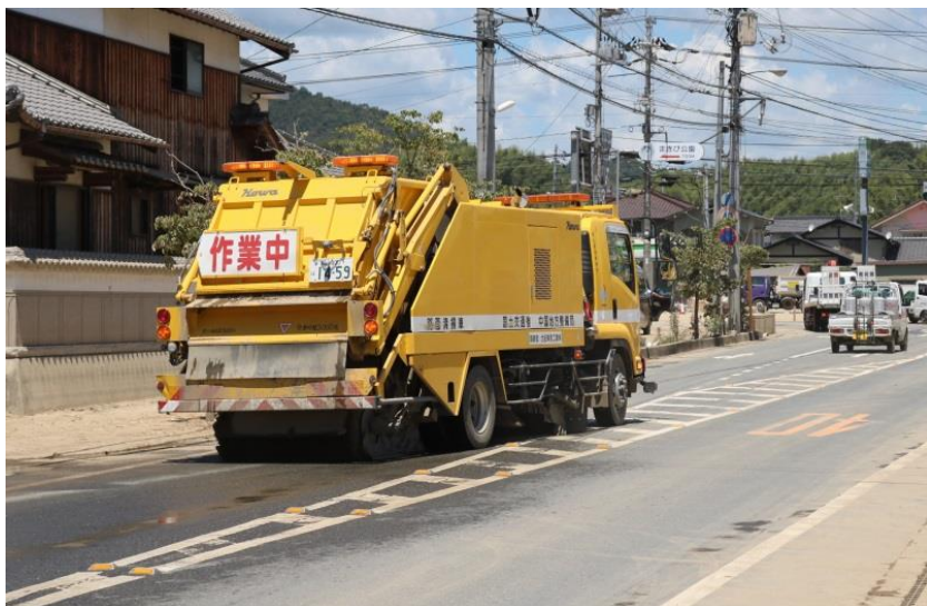
散水作業（倉敷市真備町）