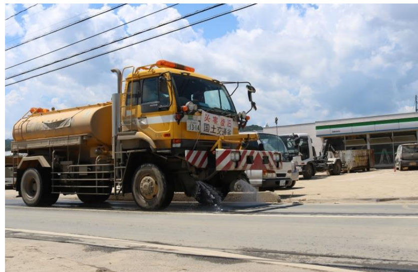
散水作業（倉敷市真備町）