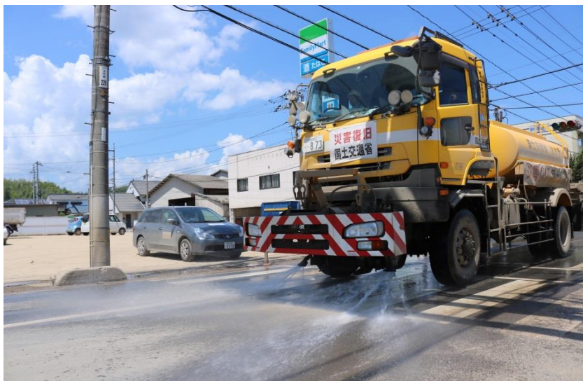
散水作業（倉敷市真備町）