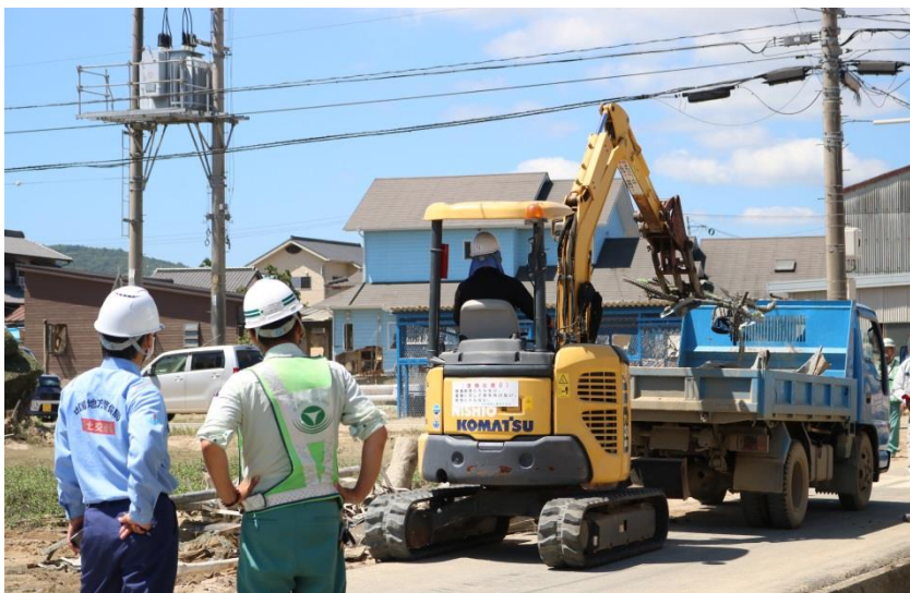
道路啓開作業（倉敷市真備町）