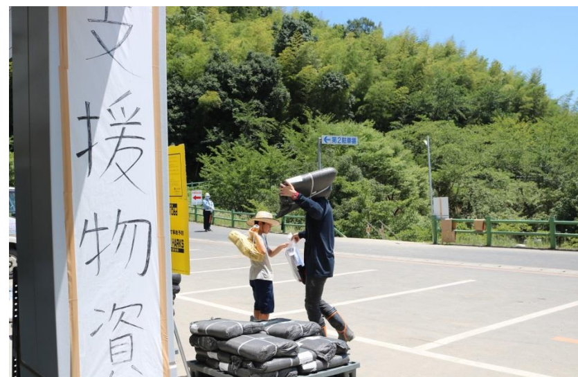
支援物資(真備総合公園)