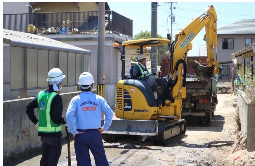
水路啓開作業（倉敷市真備町）