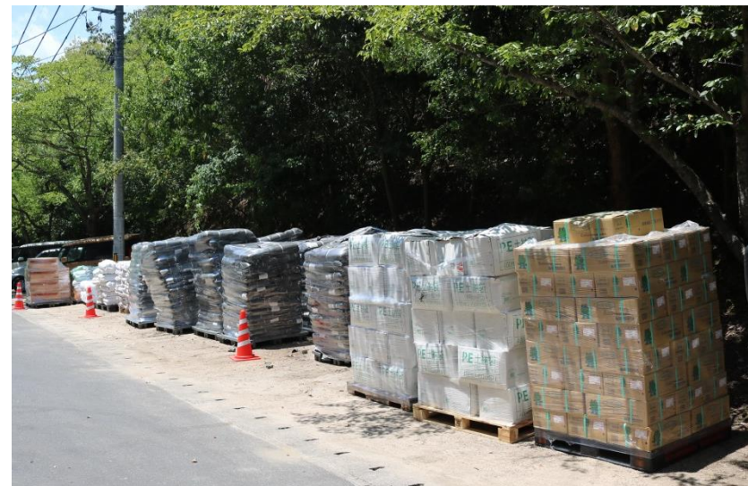
支援物資(真備総合公園)