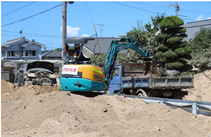
道路啓開作業（倉敷市真備町）