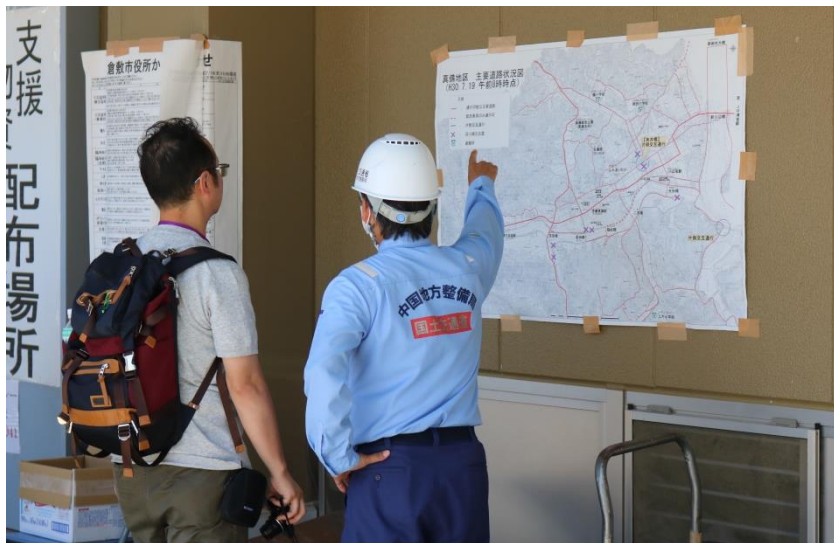
掲示状況(真備総合公園)