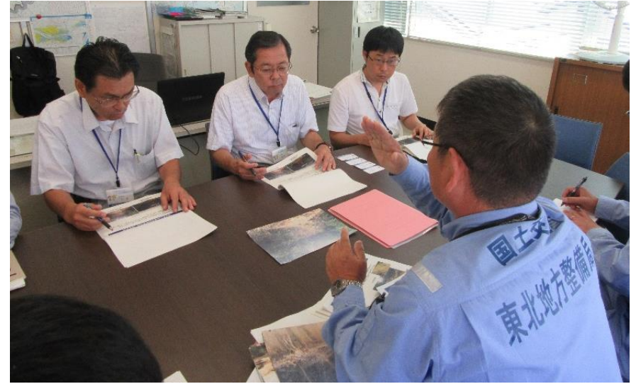
岡山県美作県民局建設部長への調査結果の説明