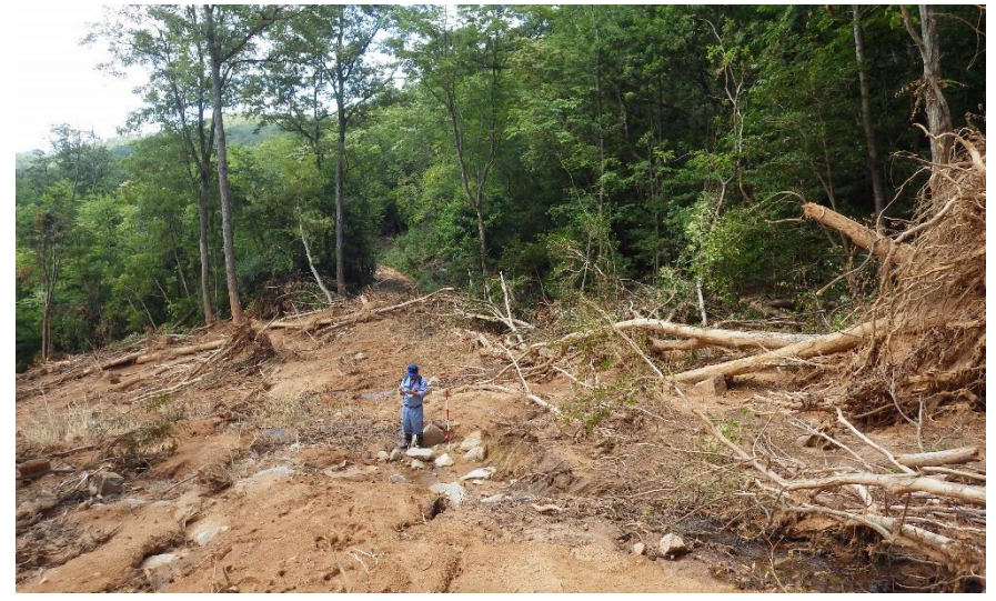
被災状況調査(東広島市)