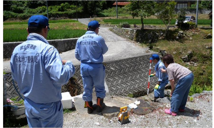
地元住民からの聞き取り(新見市)