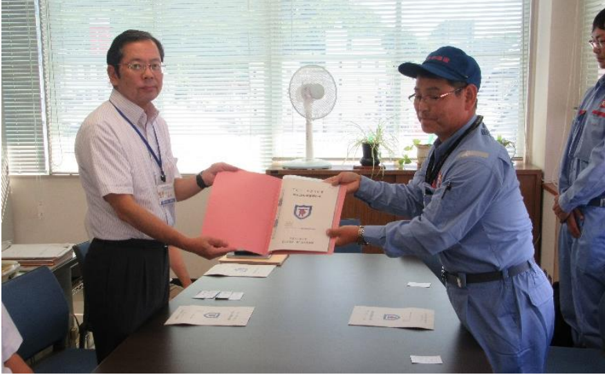
岡山県美作県民局建設部長への調査結果の報告