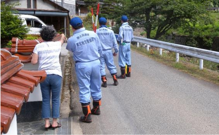
地元住民からの聞き取り(新見市)