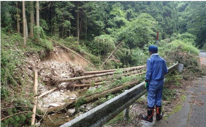
被災状況調査(新見市)