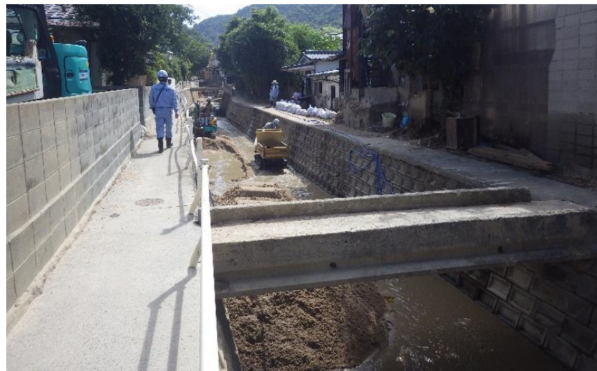
現地状況確認（呉市天応地内）