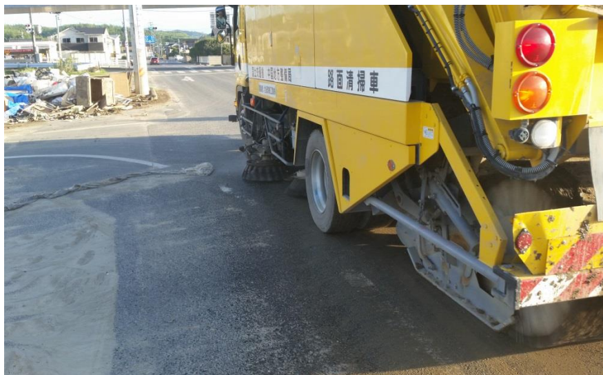
清掃作業（倉敷市真備町）