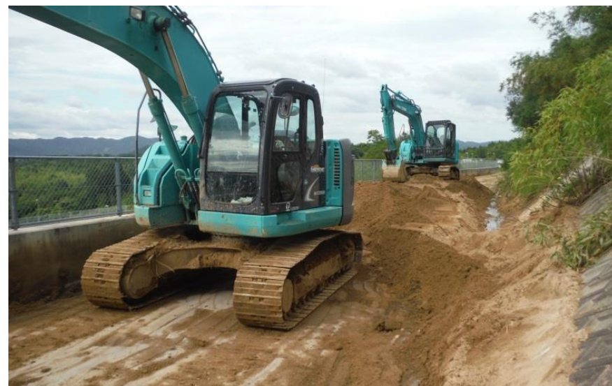
道路啓開作業（東広島市高屋地内）