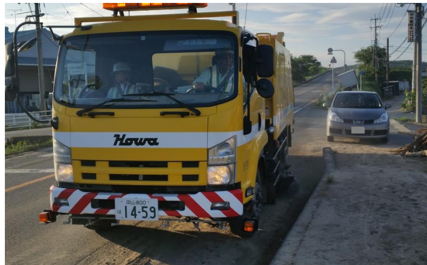
清掃作業（倉敷市真備町）