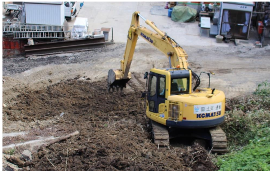
道路啓開作業（福山市郷分地内）