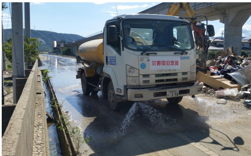
散水作業（倉敷市真備町）