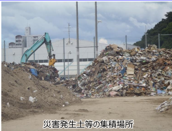
災害発生土等の集積場所