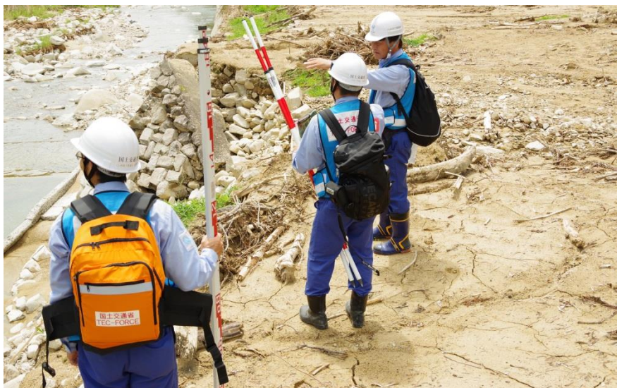
現地調査（呉市安浦町内）