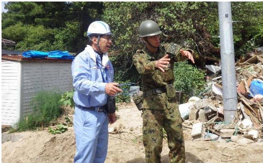
自衛隊との情報交換（呉市天応地内）