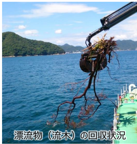
漂流物（流木）の回収状況