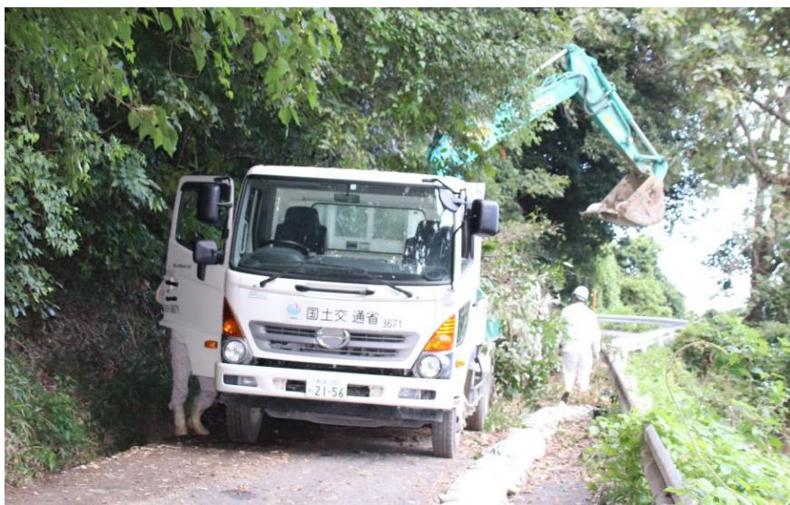
道路啓開作業（福山市郷分地内）