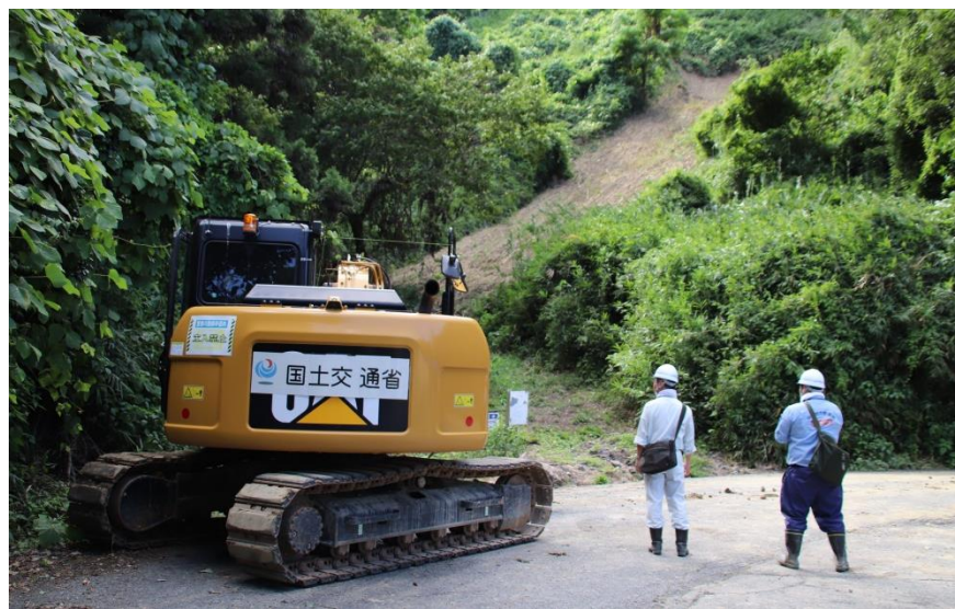
道路啓開作業（福山市郷分地内）