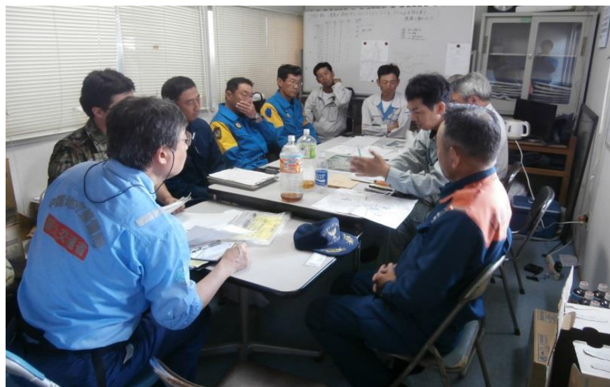
打合せ状況（坂町小屋浦地内）