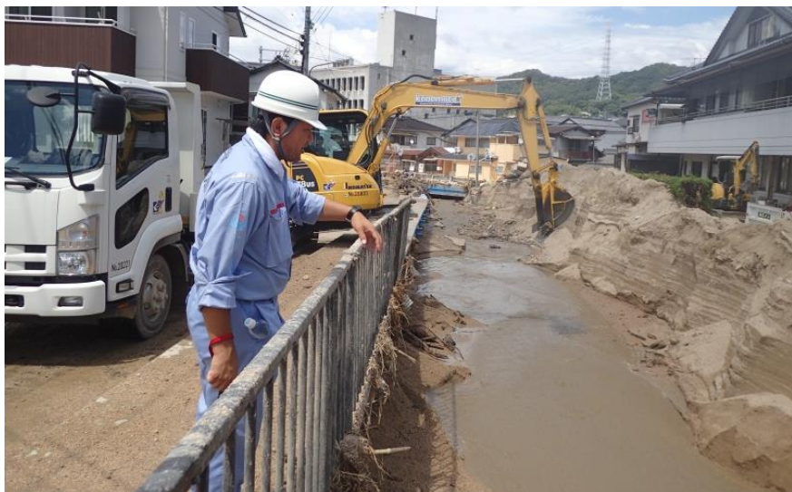
現地状況確認（坂町坂西地内）