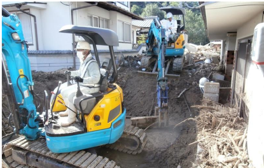
道路啓開作業（坂町小屋浦地内）