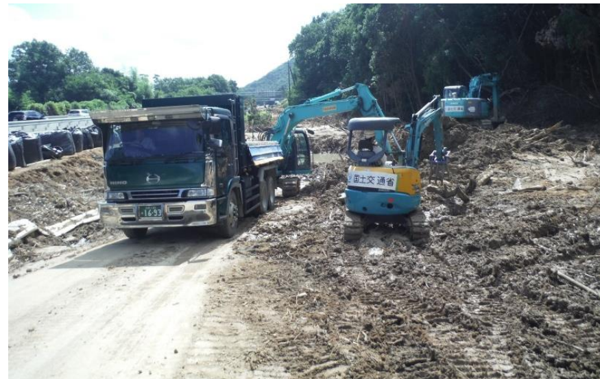
道路啓開作業（東広島市高屋地内）