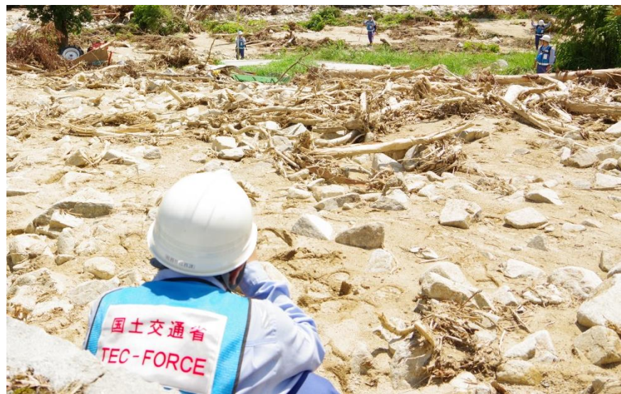
現地調査（呉市安浦町内）