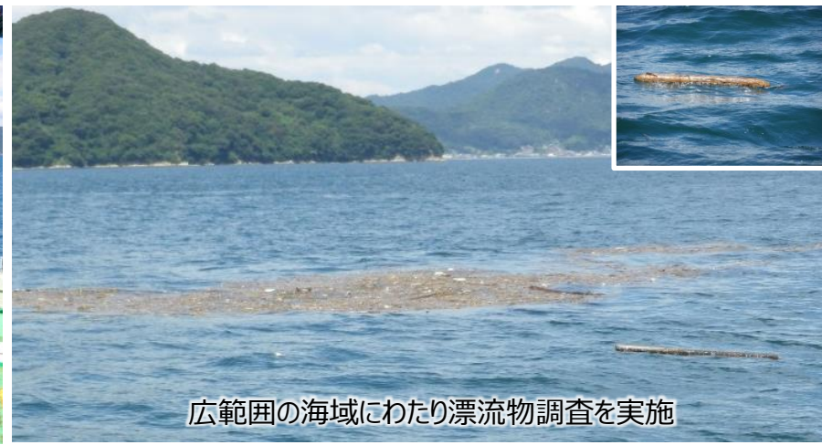
広範囲の海域にわたり漂流物調査を実施