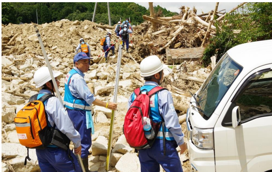
現地調査（呉市安浦町内）