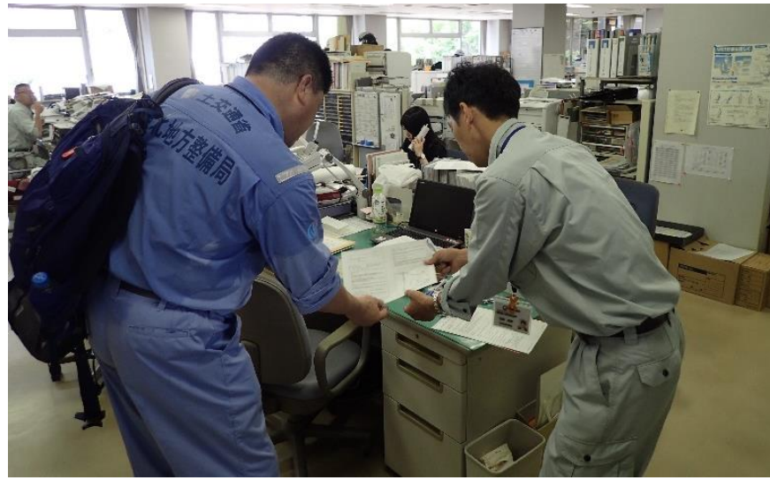
坂町担当者との打合せ（坂町役場）