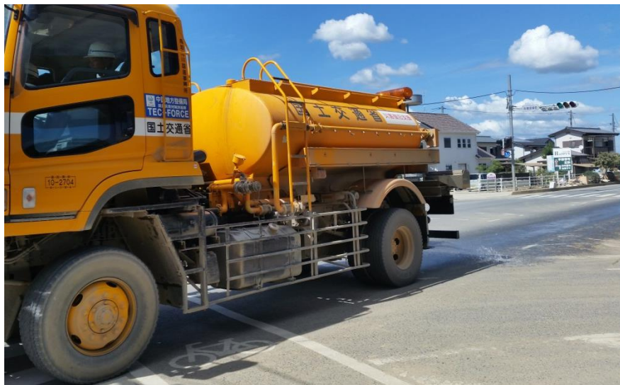
散水作業（倉敷市真備町）