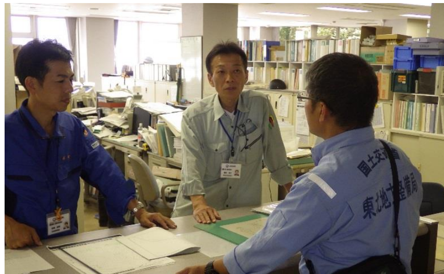
坂町との打合せ（坂町坂西）