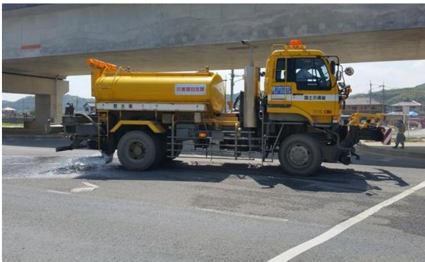
散水作業（倉敷市真備町）