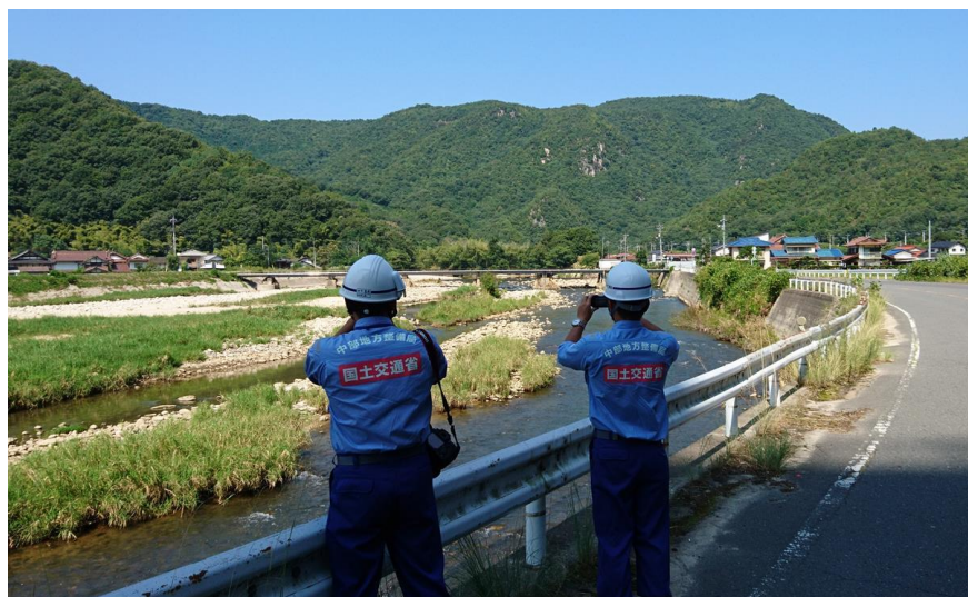
現地状況確認（三原市）