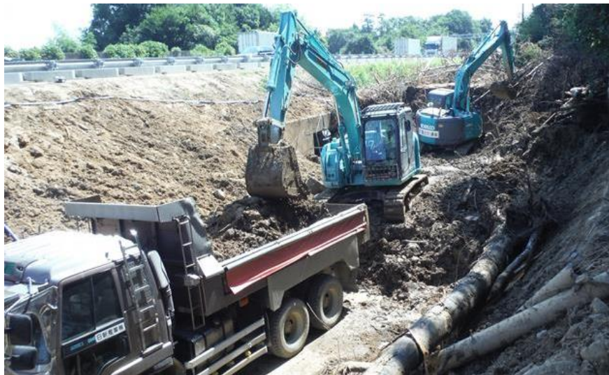
土砂撤去作業（東広島市高屋町）