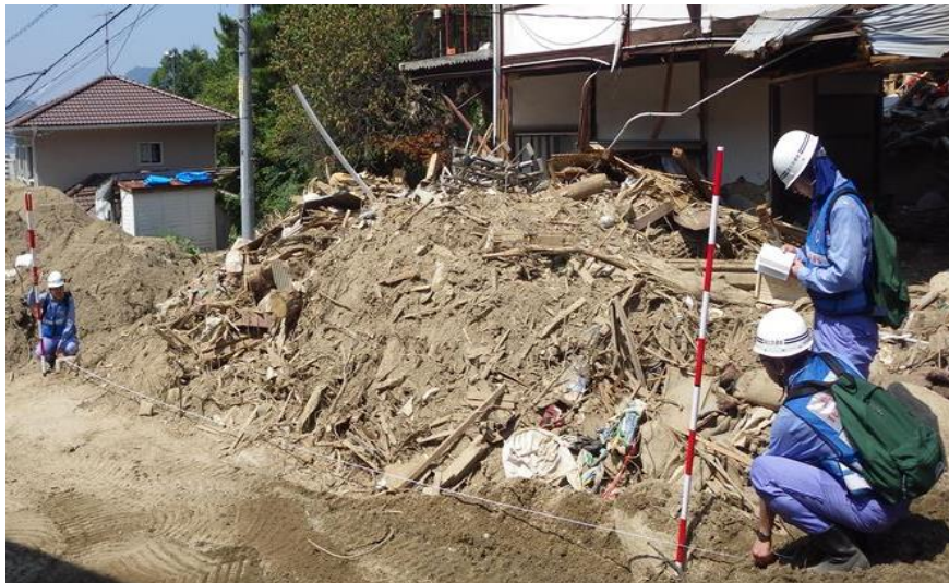
現地状況確認（呉市天応町）