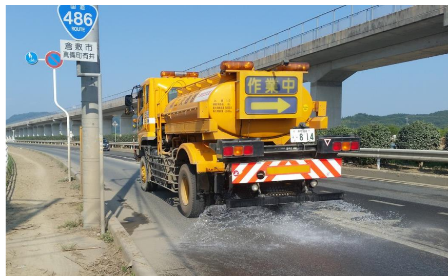
散水作業（倉敷市真備町）