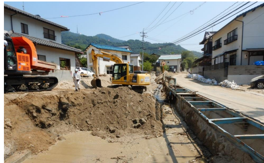
土砂撤去作業（坂町坂西）