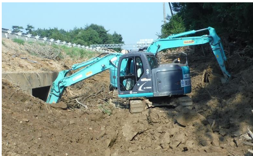
土砂撤去作業（東広島市高屋町）