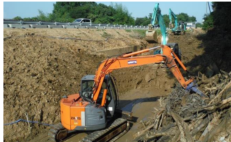
土砂撤去作業（東広島市高屋町）