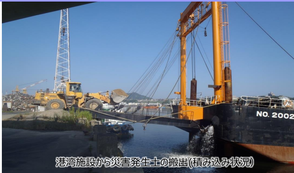
港湾施設から災害発生土の搬出(積み込み状況)