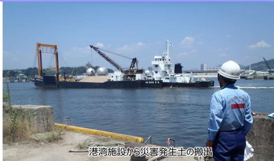
港湾施設から災害発生土の搬出