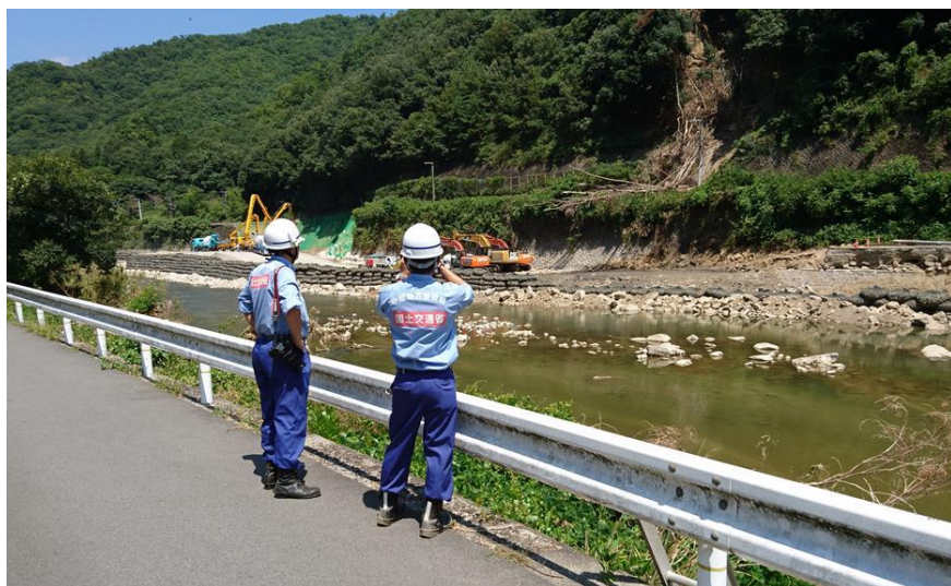
現地状況確認（三原市）