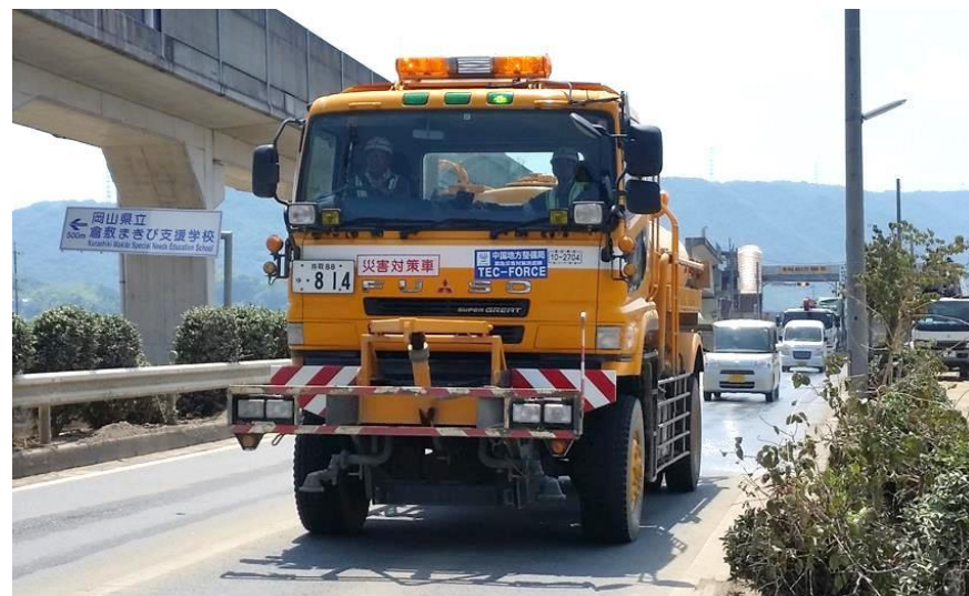
散水作業（倉敷市真備町）