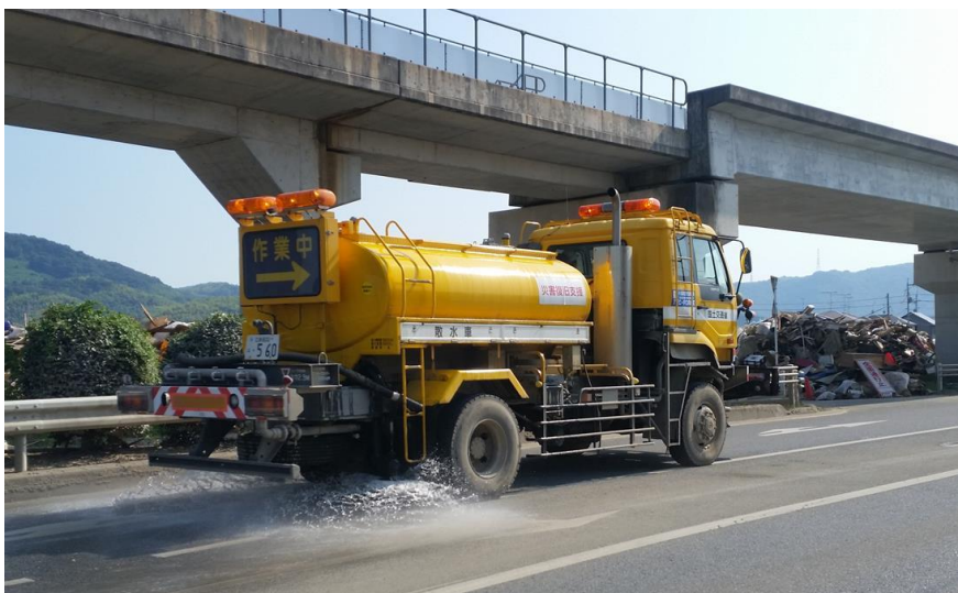
散水作業（倉敷市真備町）