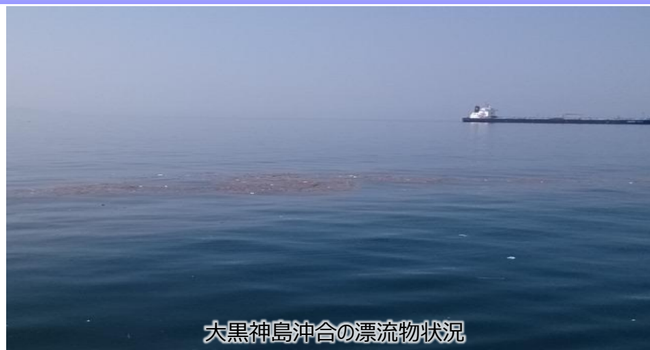
大黒神島沖合の漂流物状況