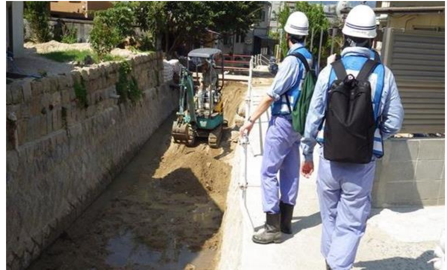
現地状況確認（呉市天応町）