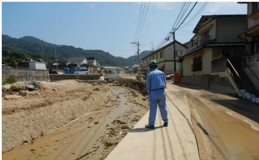
現地状況確認（坂町坂西）