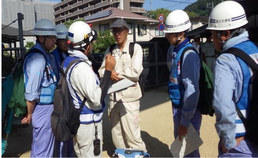
関係機関会議（呉市天応町）