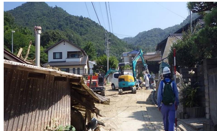
現地状況確認（呉市天応町）