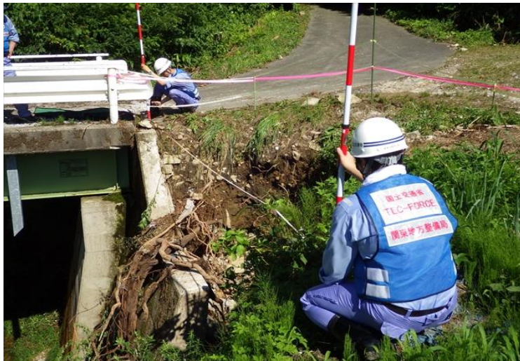
高梁川支川 被災状況調査