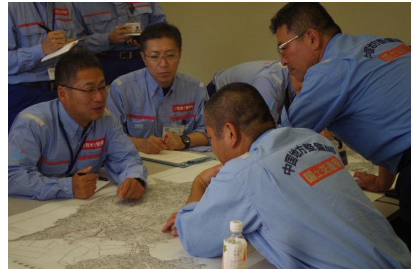
調査箇所打合せ（中国・北陸地整）