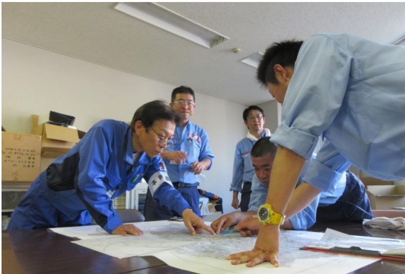
坂町との被災箇所確認