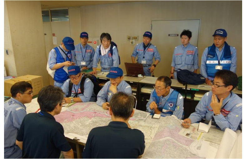
倉敷市役所 打ち合わせ状況