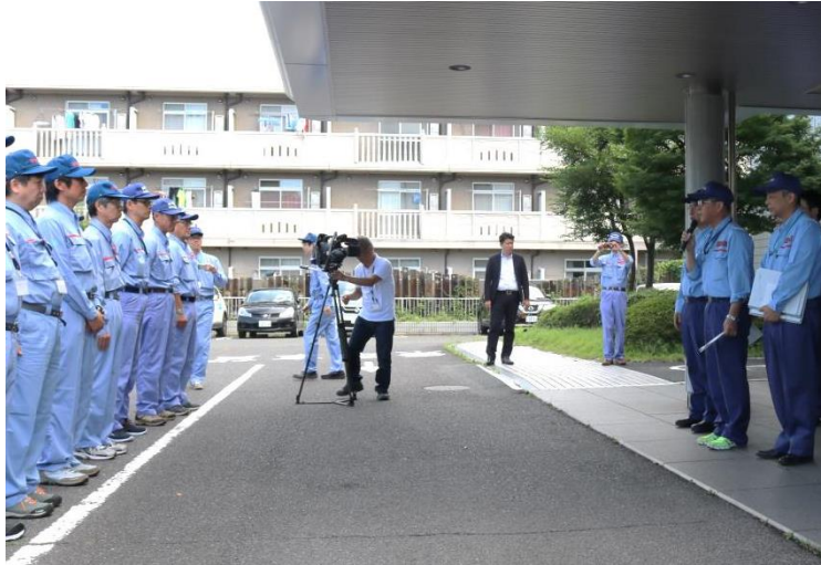
岡山国道事務所 出発式