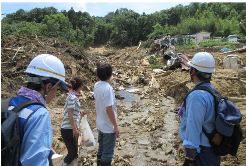
地域住民からの聞き取り