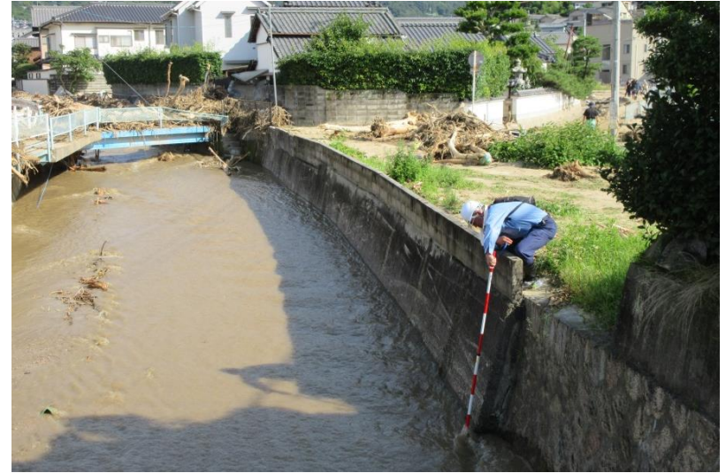
坂町（総頭川）被災状況調査