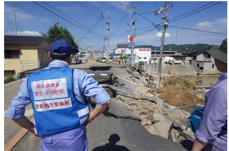
真備町 地域住民とのコミュニケーション