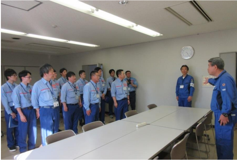
坂町長による激励