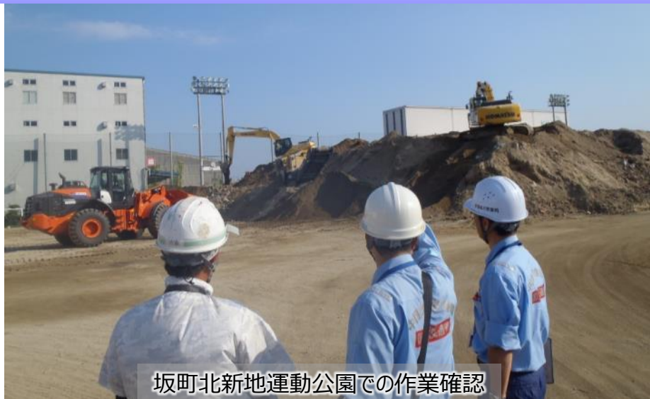
坂町北新地運動公園での作業確認