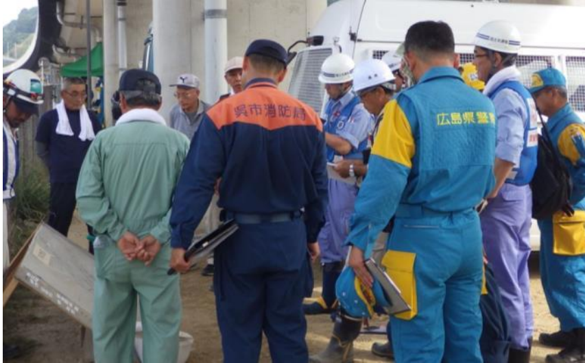
関係機関会議（呉市天応町）