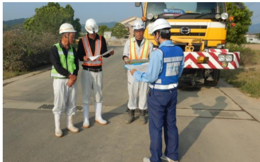
打合せ状況（倉敷市真備町）