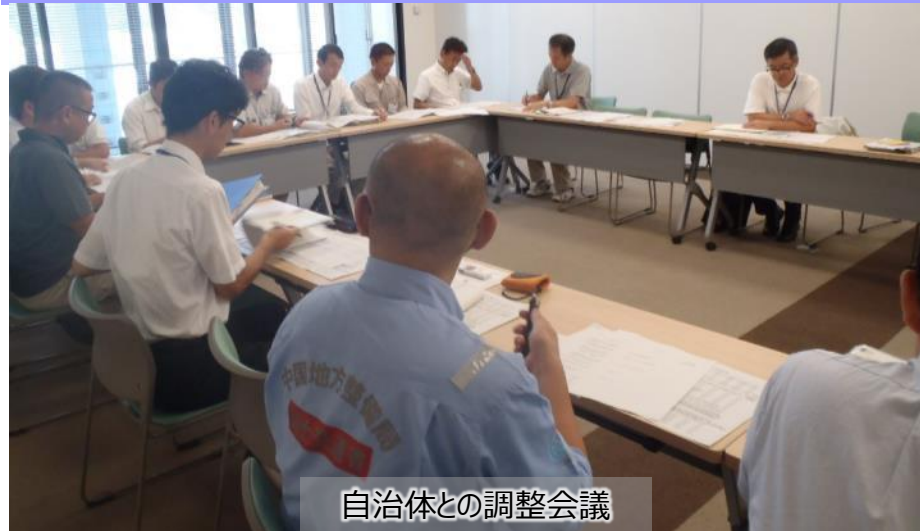
自治体との調整会議