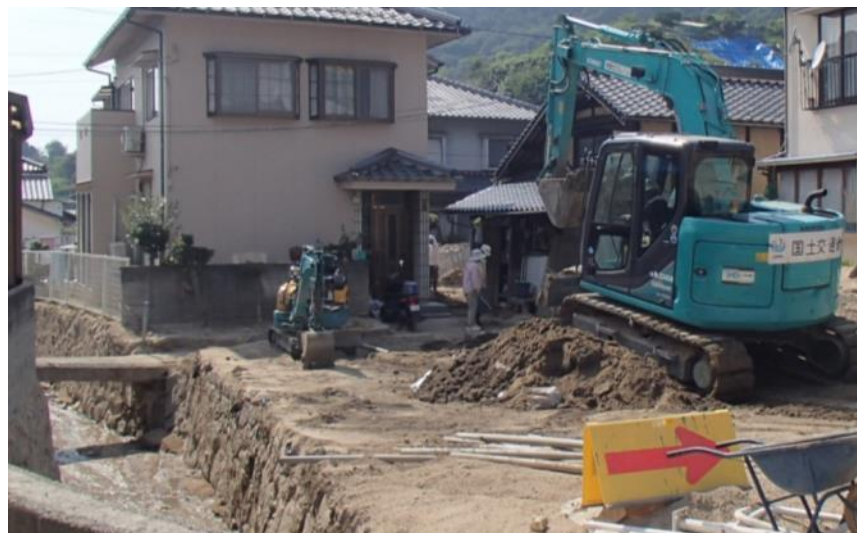
土砂撤去作業 (坂町小屋浦)