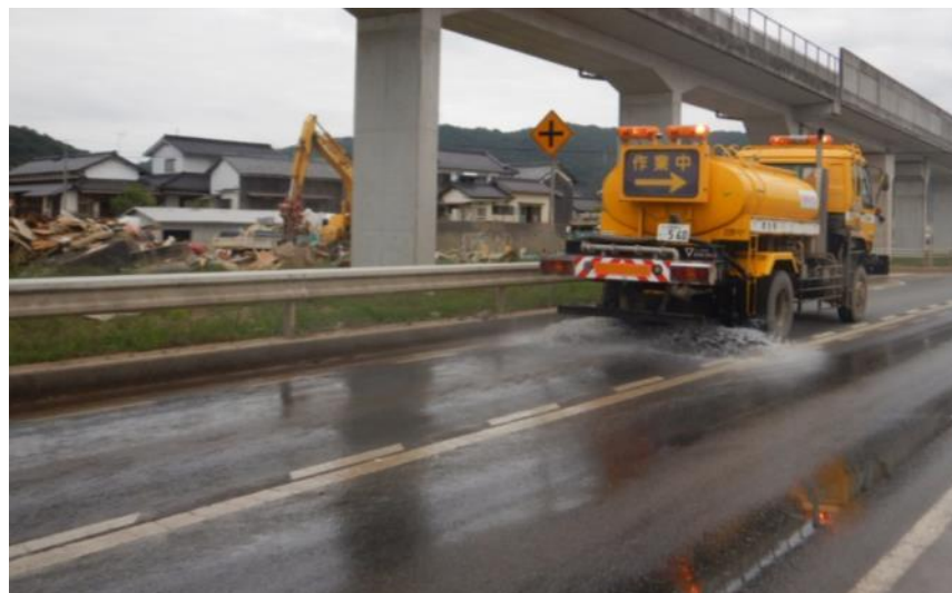
散水作業（倉敷市真備町）