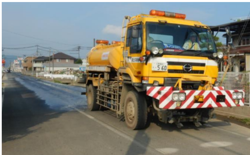
散水作業（倉敷市真備町）