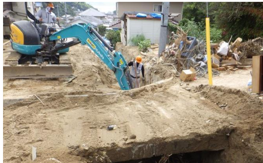
土砂撤去作業 (呉市天応町)