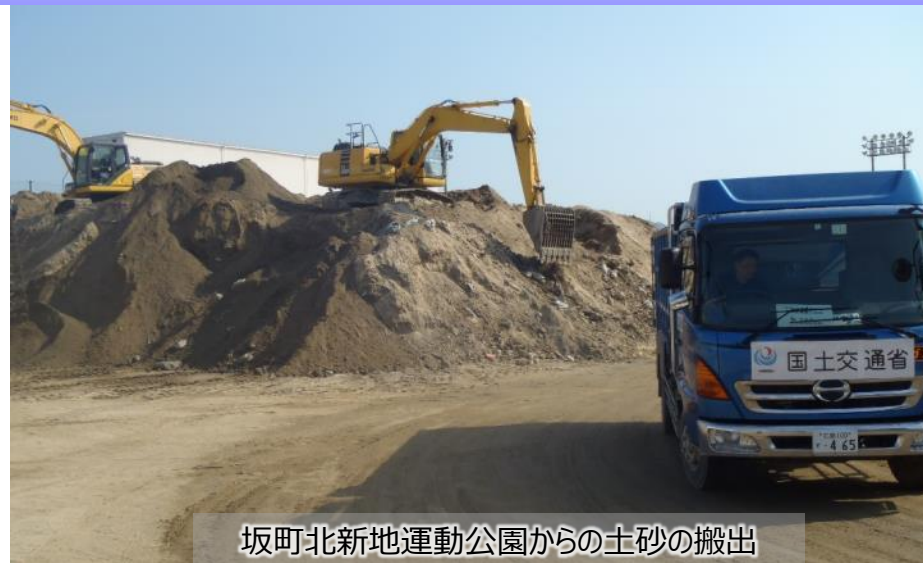
坂町北新地運動公園からの土砂の搬出