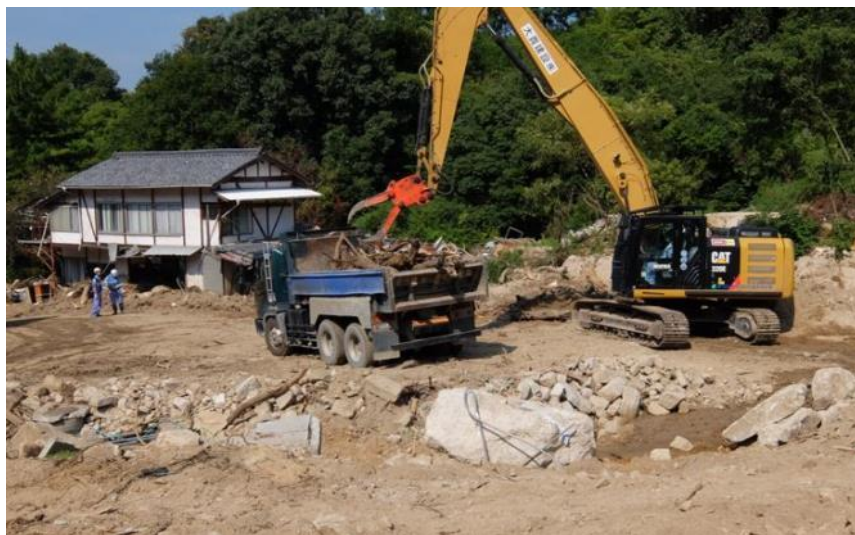
道路啓開作業 (呉市天応町)