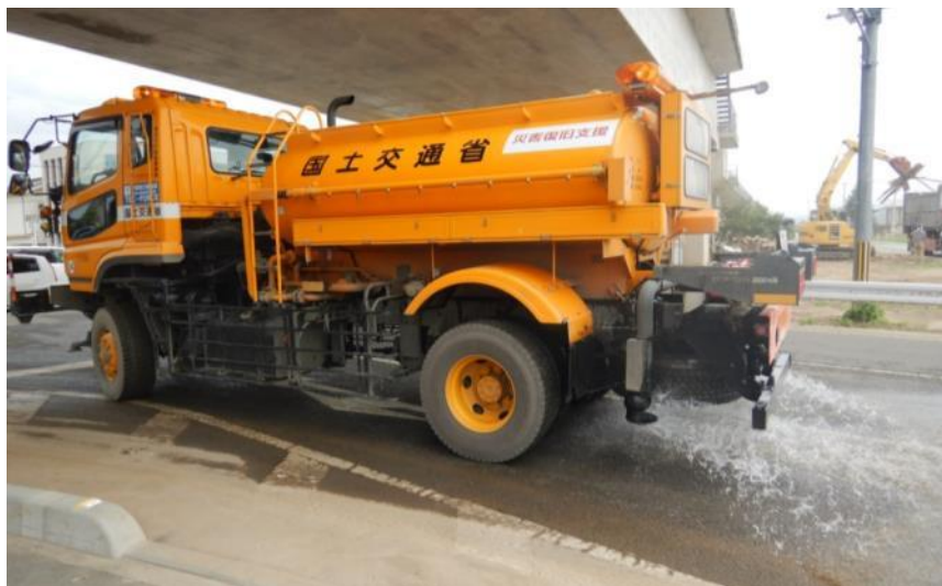
散水作業（倉敷市真備町）