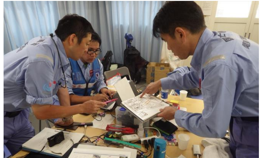
打合せ状況（呉市天応町）