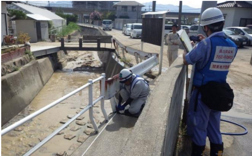
現地状況確認（呉市天応町）