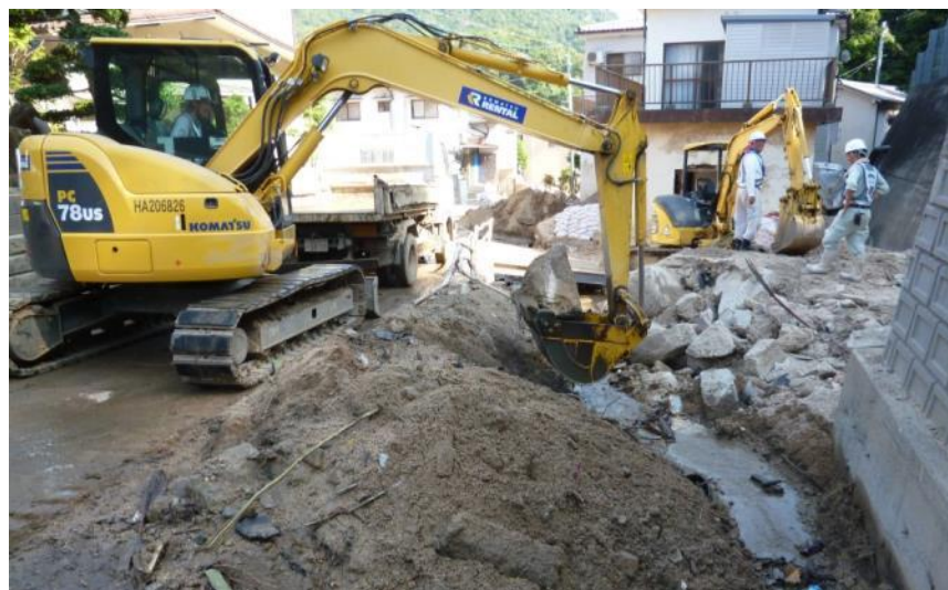
道路啓開作業 (坂町小屋浦)