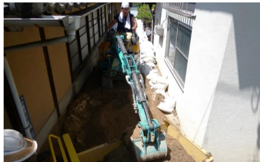
道路啓開作業 (坂町小屋浦)