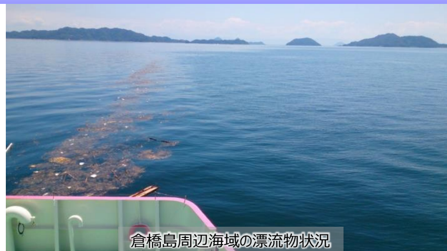
倉橋島周辺海域の漂流物状況