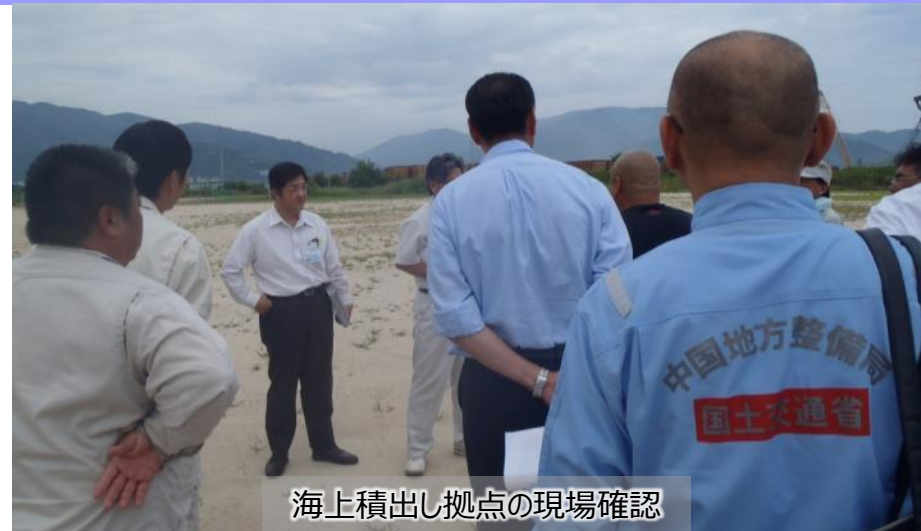
海上積出し拠点の現場確認