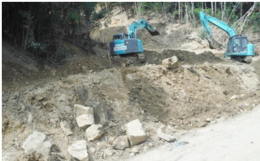
道路啓開作業（東広島市高屋町）