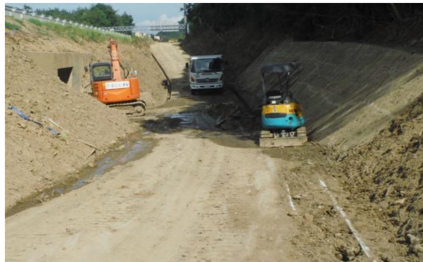
道路啓開作業（東広島高屋町）