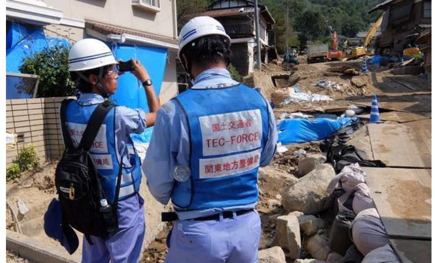
現地状況確認（呉市天応町）