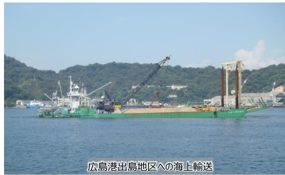
広島港出島地区への海上輸送