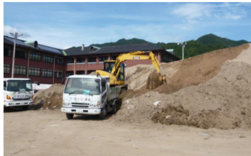
土砂撤去作業 (坂町小屋浦)