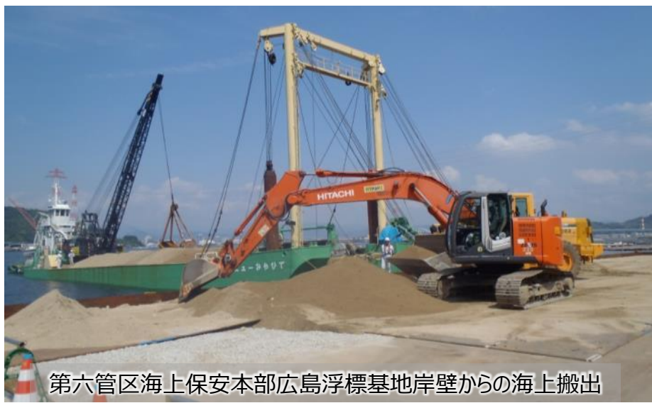
第六管区海上保安本部広島浮標基地岸壁からの海上搬出