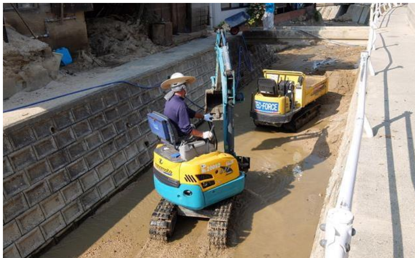
土砂撤去作業 (呉市天応町)