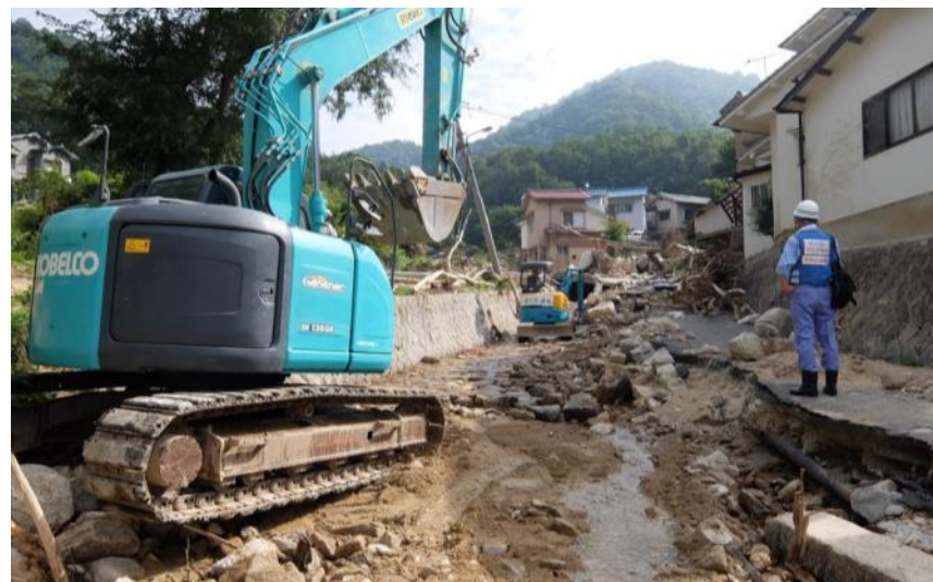
道路啓開作業 (呉市天応町)