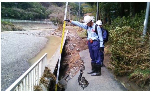
護岸崩落箇所の調査（埼玉県飯能市：河川班②）