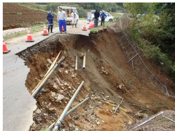
道路崩落箇所の調査 （長野県川上村：道路班③）