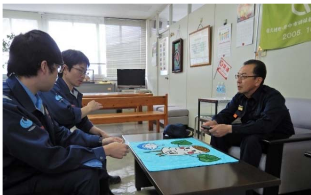
長野県佐久穂町長との面会（道路班②）