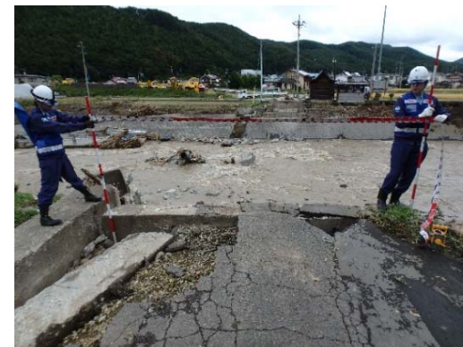
梨ノ木橋落橋箇所の調査 （佐久穂町：道路班②）