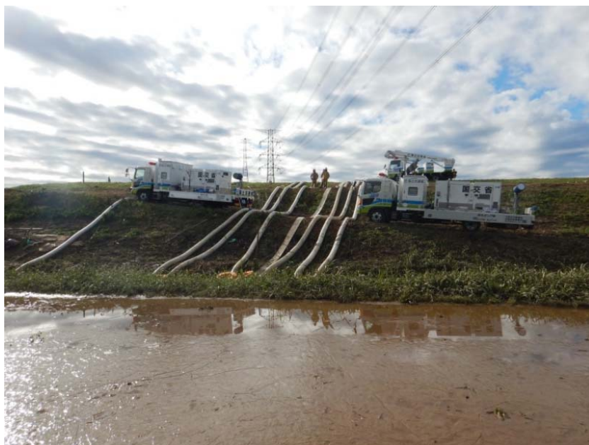
【埼玉県・越辺川】排水ポンプ車による排水作業（応急対策班）