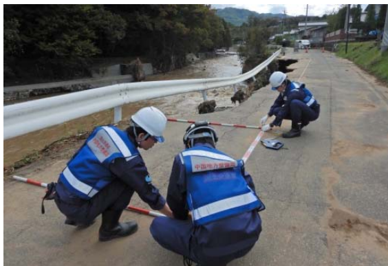
護岸崩落箇所の調査（佐久穂町：道路班②）