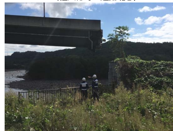
海野宿橋落橋箇所の調査 （長野県東御市：道路班④）