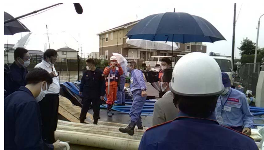
福岡県大牟田市の排水作業を武田内閣府特命担当大臣が視察