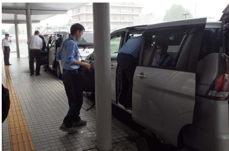
九州地方に向けて出発する班員