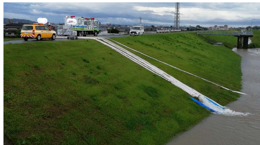
あやひろ 文廣排水機場（福岡県みやま市）における排水作業