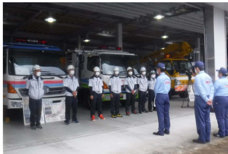
排水ポンプ車・照明車 出発式