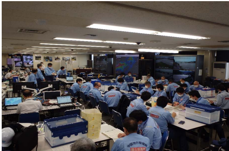
出発前に説明を受ける班員の様子