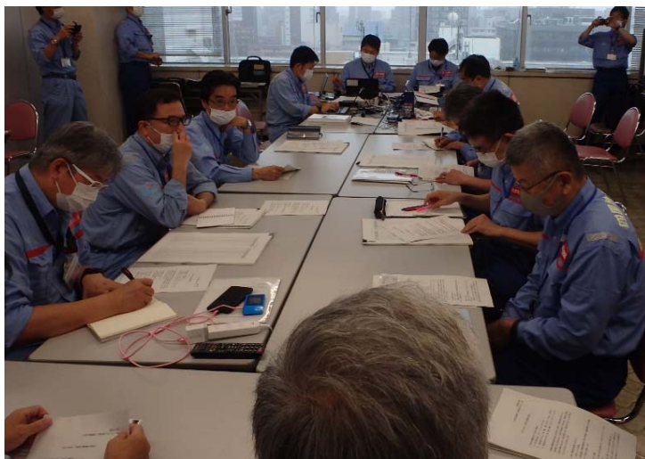
九州地整、他地整テックフォースと打合せ