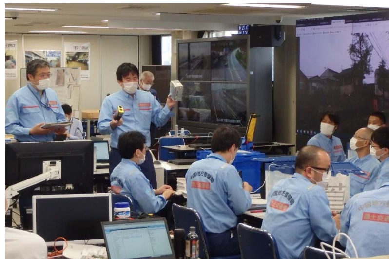
班員に説明を行う防災室職員