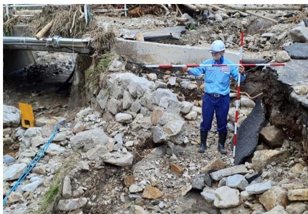
現地調査（うんなんしよだちょうふかの雲南市吉田町深野）