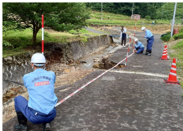
現地調査（いいなんちょううどだに飯南町井戸谷）