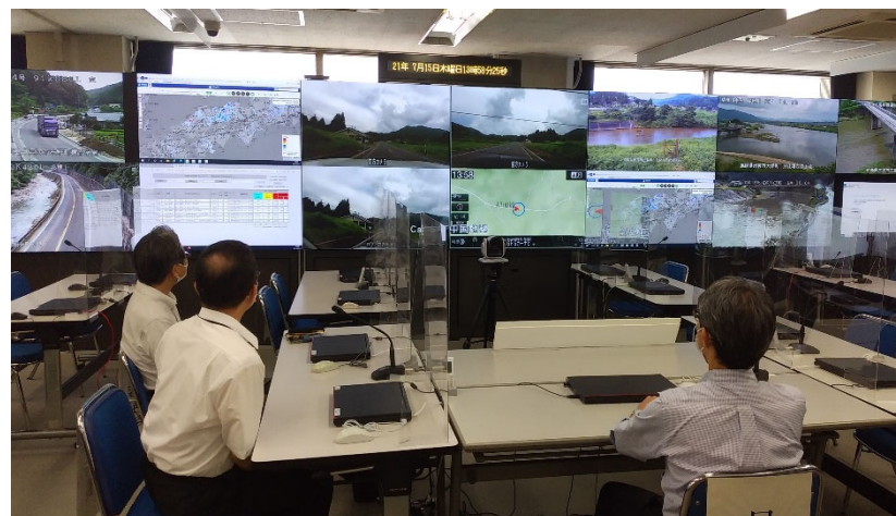
Car-SAT映像確認（中国地方整備局）