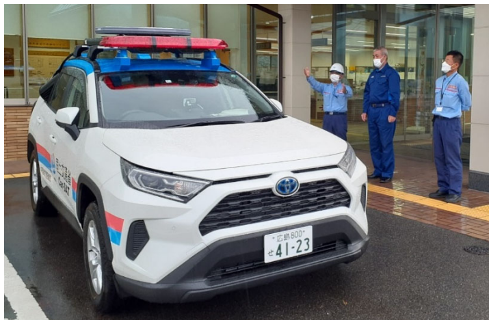
飯南町長にCar-SAT車両説明