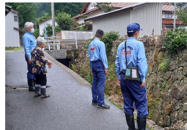
地元住民から被災状況の聞き取り （いいなんちょうあかな飯南町赤名）