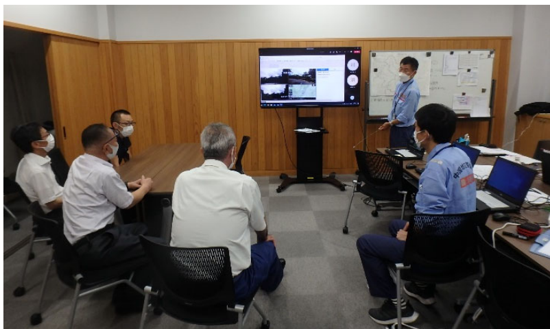
いいなんちょう Car-SAT映像確認（飯南町役場）