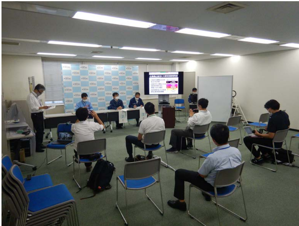
合同記者会見の状況