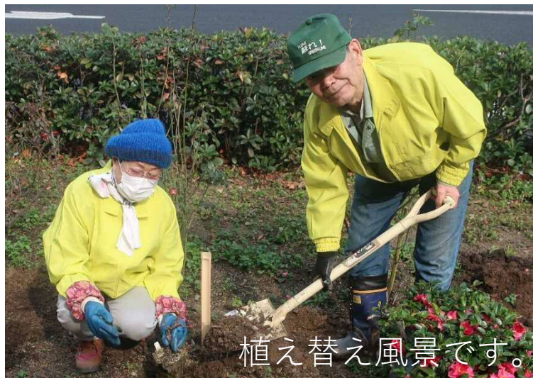
植え替え風景です。

2月20日にVSP団体「文化の薫る福山を考える会」の皆さんと一緒に30本のばらの植え替えを行いました。春になりたくさんのばらが咲いていくのが楽しみです。