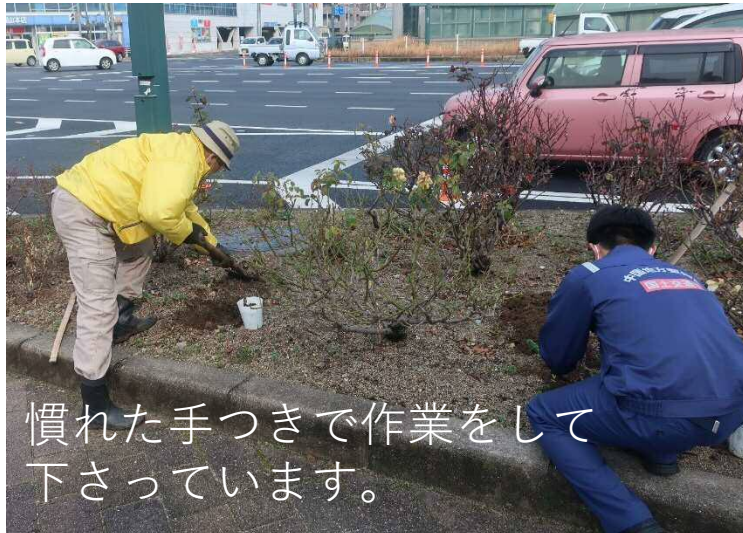
慣れた手つきで作業をして下さっています。