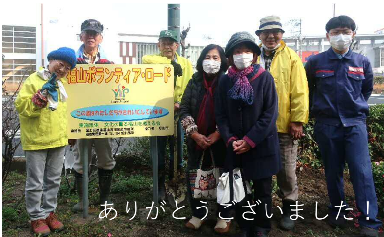
ありがとうございました！