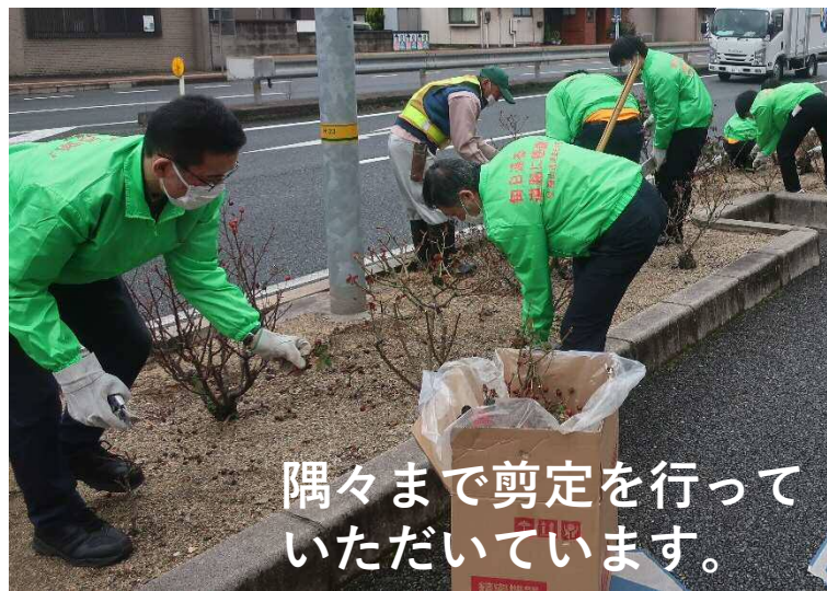
隅々まで剪定を行っていただいています。