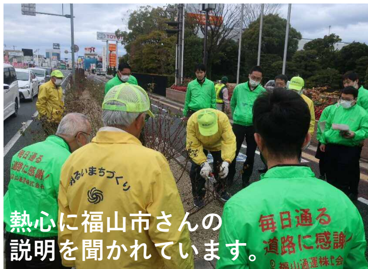
熱心に福山市さんの説明を聞かれています。

3月6日にVSP団体「福山通運株式会社」の皆さんと一緒にばらの剪定を行いました。毎年この時期に剪定を行っており、剪定の説明を受けながら丁寧に作業を行っていただきました。いつもありがとうございます。