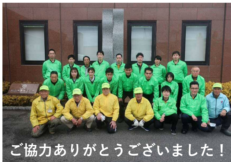
ご協力ありがとうございました！