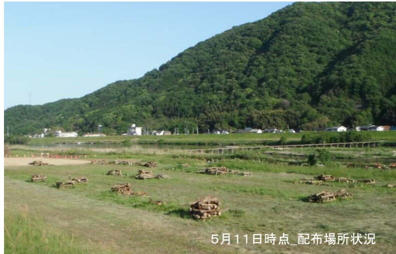
5月11日時点_配布場所状況