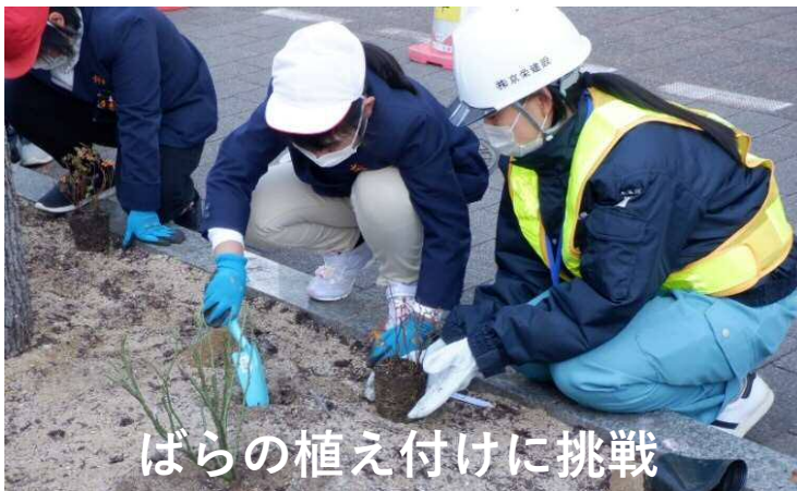
ばらの植え付けに挑戦