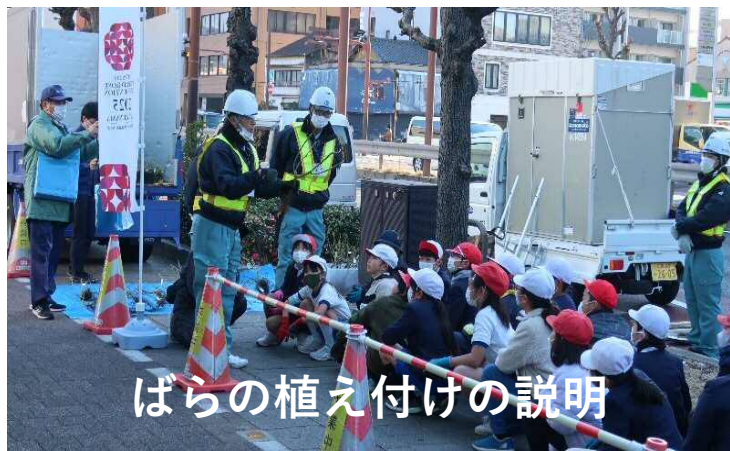
ばらの植え付けの説明

ばらを植えるのは難しかったけどたのしかったです。 たくさんばらを植えてばらの町ふくやまにしていきたいです。