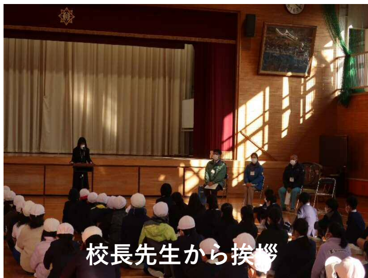
校長先生から挨拶

一般国道2号の自転車走行空間整備により、新しくなった植樹柵に、「福山市立南小学校4年生」の児童約60名と協力企業「株式会社京栄建設」とばらの植樹を行い、植樹柵のリニューアルをしました。