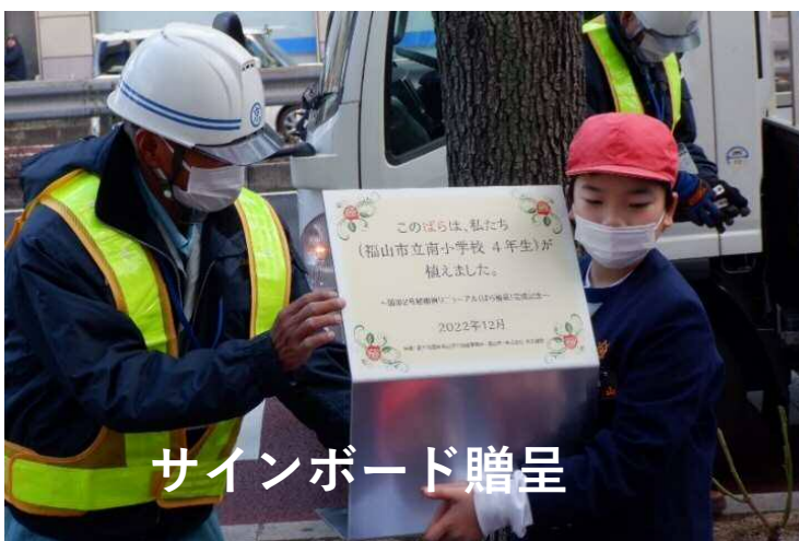
サインボード贈呈

VSP(ボランティア・サポート・プログラム)とは、道路を対象に実施している道路の美化・清掃プログラムです。一般国道2号でボランティア活動に参加していただける団体を募集しています。お気軽にお問い合わせください。 発行：国土交通省中国地方整備局福山河川国道事務所 道路管理課 TEL 084-923-2620