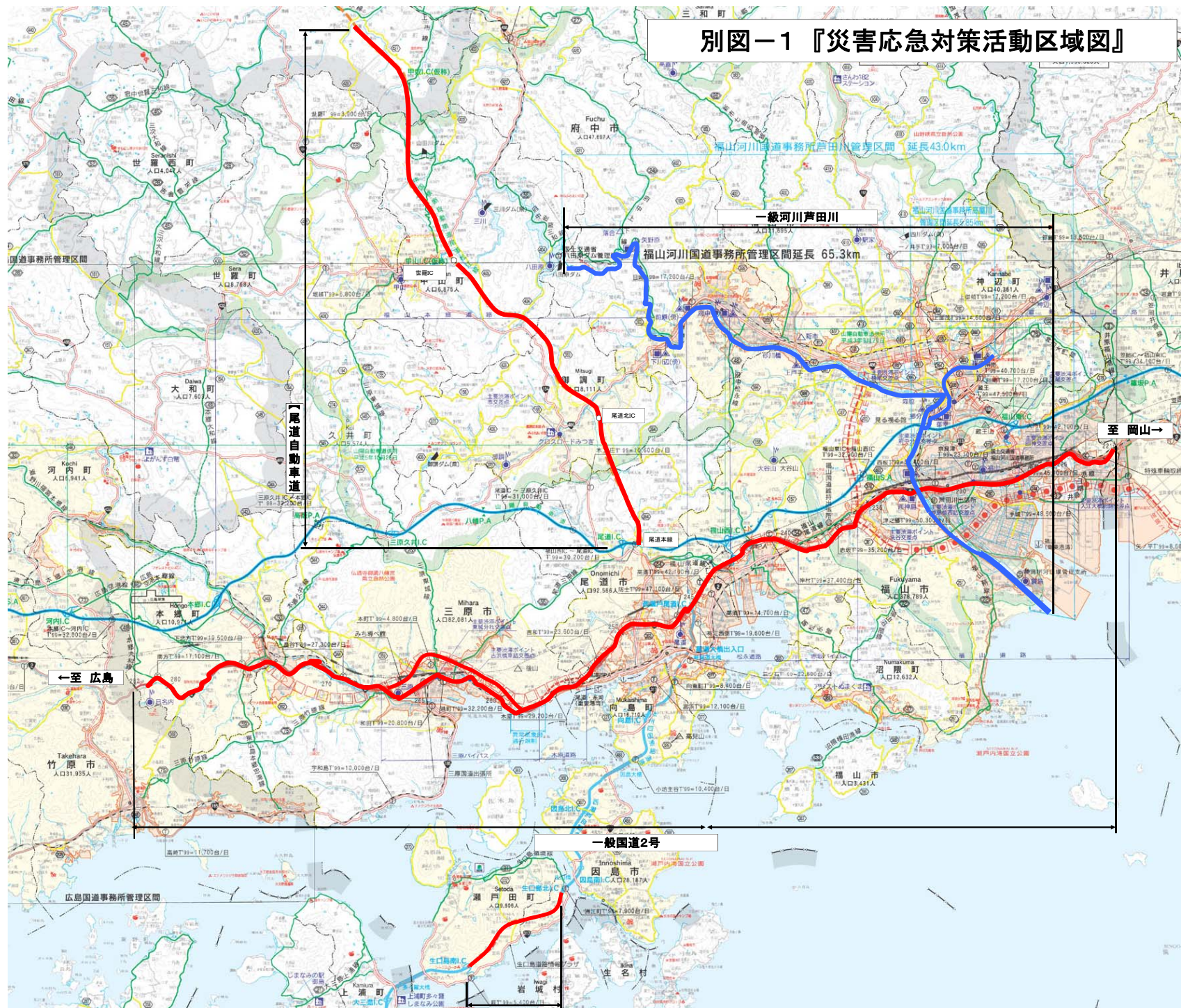
別図-1 『災害応急対策活動区域図』