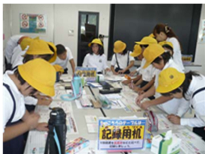
パックテスト体験