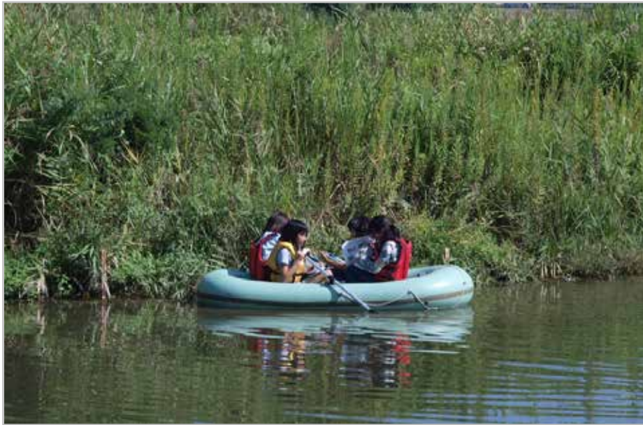
ボードでの植生調査状況（ウェットランド）