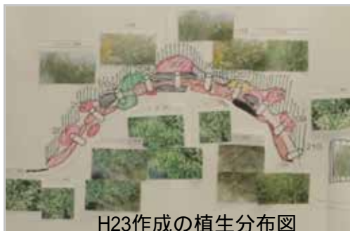
H23作成の植生分布図