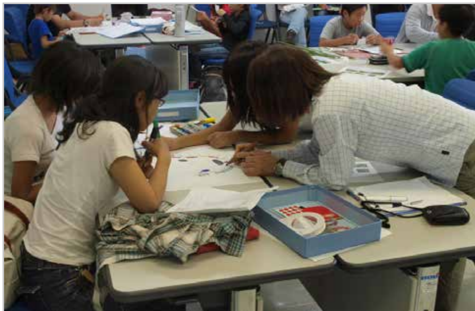
調査成果のとりまとめ状況（芦田川見る視る館）