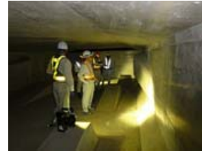
前回実施状況（平成24年10月24日）