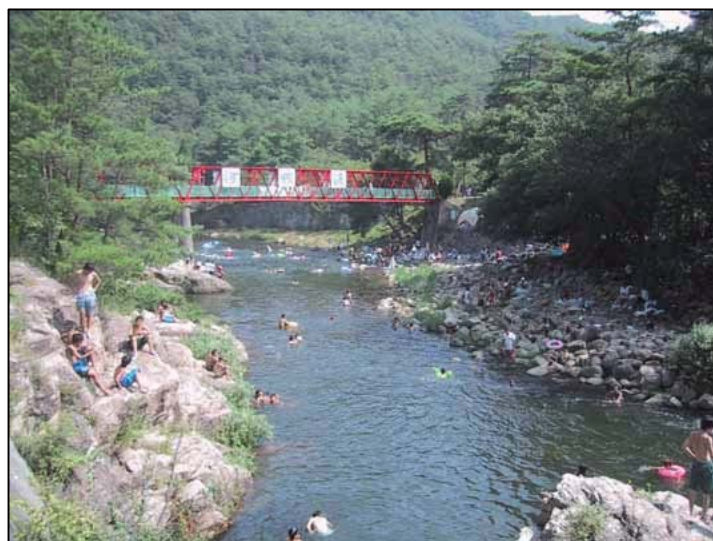
河佐峡 前回評価 : ★★★★★ (すばらしい)